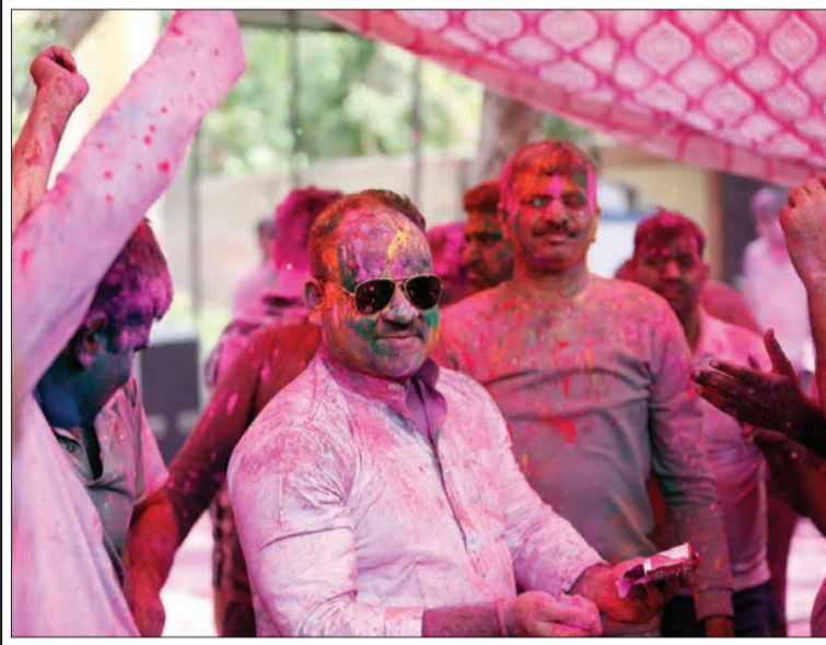
अनुशासन और तनाव के बीच रहने वाले पुलिस वाले होली के अगले दिन कुछ अलग ही रंग में नजर आए। सभी रैंक एक बराबर और सभी चेहरे रंगों में सराबोर और गीतों और ढोल की धाप में थिरकते कदम इस बात का अहसास दिला रहे थे... कि शहर में होली शांतिपूर्ण तरीके से बीत गई। होली के अगले दिन गौतमबुद्धनगर पुलिस कमिश्नरेट के विभिन्न थानों में पुलिसकर्मियों ने जमकर होली खेली। कुछ पुलिसकर्मियों ने डीजे की धुन पर नागिन डांस किया वहीं कुछ पुलिसकर्मी ढोल की धाप पर खूब नाचे।