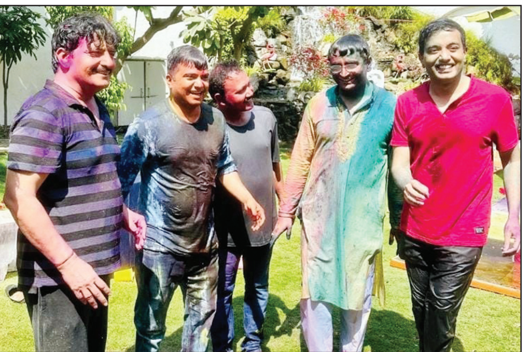
सेक्टर-14 ए में होली खेलते नोएडा प्राधिकरण के सीईओ डॉ. लोकेश एम। सीईओ संजीव खत्री, जिलाधिकारी मनीष वर्मा तथा अन्य अधिकारी।

प्राधिकरण मिलकर आधा आधा वहन कर रहे हैं। अधिकारियों ने बताया कि हिंडन पर पुल बनाने का लगभग 70 प्रतिशत काम पूरा हो गया है। यह पुल करीब 200 मीटर और सिक्स लेन का बन रहा है। इस पर लगभग 70 करोड़ रुपए का खर्चा आ रहा है। साथ ही नोएडा प्राधिकरण अपने हिस्से में करीब 32 करोड़ की लागत से सड़क और दूसरे काम करा रहा है। प्राधिकरण के अधिकारियों ने बताया कि सड़क बनाने का काम तेजी से जारी है। जून के आखिरी तक सड़क बनाने का काम पूरा हो जाएगा, लेकिन पुल बनने तक यह योजना अभी अधूरी है। सेतु निगम को भी जून तक काम पूरा करने के लिए कहा गया है, लेकिन मौके पर बचे काम के हिसाब से अगस्त से पहले यह संभव नहीं है। (शेष पृष्ठ-3 पर)