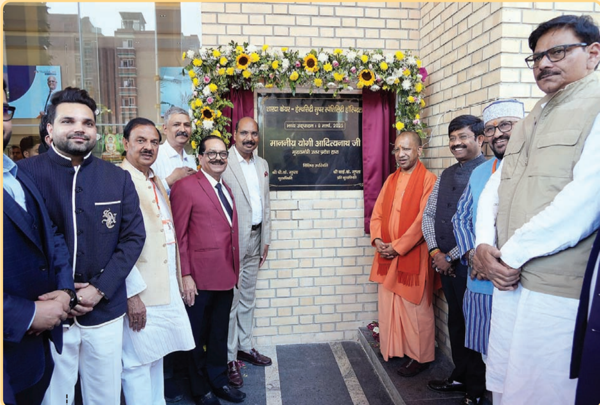
मुख्यमंत्री योगी आदित्यनाथ ने ग्रेटर नोएडा में 'शारदा केकर-हेल्थ सिटी' का उद्घाटन किया। 600 बेड के इस हॉस्पिटल में हर अत्याधुनिक सुविधा उपलब्ध होगी।