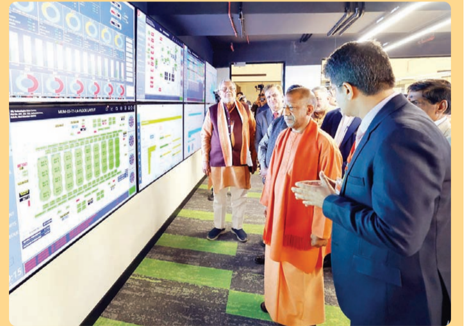
मुख्यमंत्री योगी आदित्यनाथ ने नोएडा में सिफो इन्फिनिट स्पेसेस लिमिटेड के उत्तर भारत के सबसे बड़े AI सक्षम डेटा सेंटर का उद्घाटन किया। प्रधानमंत्री नरेंद्र मोदी के 'डिजिटल इंडिया' विजन को आगे बढ़ाते हुए नया उत्तर प्रदेश पिछले 8 वर्षों में डेटा सेंटर हब के रूप में उभरा है।