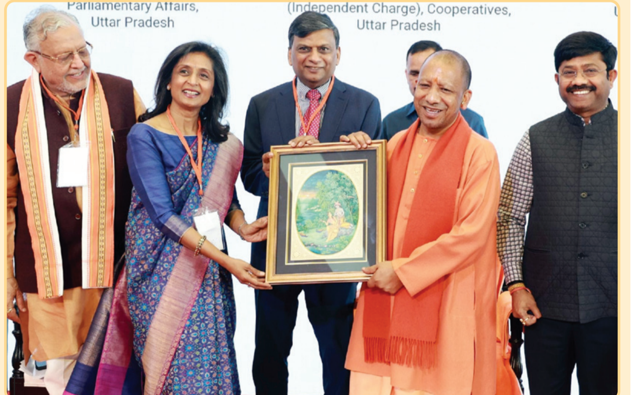
उत्तर प्रदेश के मुख्यमंत्री योगी आदित्यनाथ ने जनपद गौतमबुद्धनगर में शनिवार को MAQ Software के AI इंजीनियरिंग सेंटर का उद्घाटन किया। यह सेंटर Artificial intelligence के क्षेत्र में Research & Development की नई संभावनाओं को आगे बढ़ाएगा। इससे युवाओं को रोजगार के बेहतर अवसर भी प्राप्त होंगे।