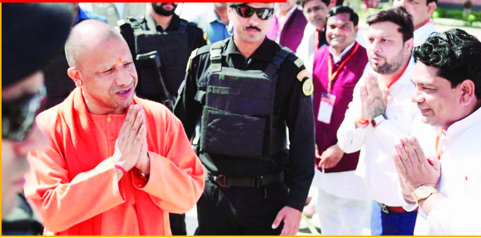
उत्तर प्रदेश के मुख्यमंत्री योगी आदित्यनाथ के सेक्टर-29 स्थित विस टाउन हेलीपैड पर आगमन पर भारतीय जनता पार्टी शहरी मोर्चा के जिला उपाध्यक्ष एवं सेक्टर-93 एक्सप्रेस व्यू अपार्टमेंट आरडब्ल्यूए के अध्यक्ष ठाकुर प्रवेश चौहान ने पुष्पगुच्छ भेंट कर उनका अभिवादन किया। ( चेतना मंच )