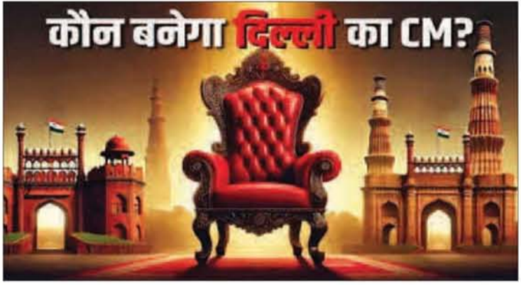
सीएम की रेस में ये नाम शामिल दिल्ली में सीएम बनने की रेस में सबसे आगे प्रवेश वर्मा का नाम है। उन्होंने नई दिल्ली सीट पर आप प्रमुख और पूर्व सीएम अरविंद केजरीवाल को हराया है, इस कारण उनका नाम सबसे आगे चल रहा है। वहीं दूसरा नाम अशीष सूद का है। जो कि दिल्ली भाजपा के महासचिव और जयपुर विधायक बने

नई दिल्ली (एजेंसी)। दिल्ली के नए मुख्यमंत्री के शपथ ग्रहण समारोह की तारीख घोषित कर दी गई है। शपथ ग्रहण समारोह 20 फरवरी को शाम 4.30 बजे रामलीला मैदान में आयोजित होगा। इस मौके पर करीब 30 हजार कुर्सियां लगाई जाएंगी। शपथ ग्रहण के लिए 3 मंच बनाए जाएंगे, जिसमें एक बड़ा मंच (40 बाई 24 का) और दो छोटे मंच भी तैयार किए जा रहे हैं। मंच पर करीब 100-150 कुर्सियां रखी जाएंगी।