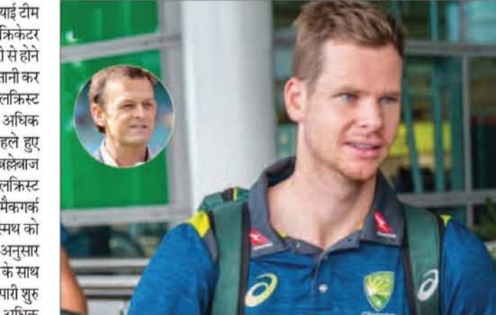
के साथ उतारना भी अच्छे प्रयोग लग रहा है। इससे बाएँ हाथ और दाएँ हाथ का अच्छे संयोजन बनेगा। वहीं स्मिथ भी पारी शुरु कर सकते हैं, टी20 में हमने उन्हें 20 अंकों के

मेलबर्न (एजेंसी)। ऑस्ट्रेलियाई टीम के करिश्माई विकेटकीपर बल्लेबाज रहे क्रिकेटर एडम गिलक्रिस्ट ने कहा कि 19 फरवरी से होने वाली आईसीसी चैंपियंस ट्रॉफी में कप्तानी कर स्टीव स्मिथ पारी की शुरुआत करें। गिलक्रिस्ट के अनुसार इससे स्मिथ को अधिक से अधिक गेंदें खेलने के लिए मिलेंगी। इससे पहले हुए श्रीलंका दौरे में स्मिथ ने मध्यक्रम के बल्लेबाज के तौर पर काफी कम रन बनाये थे। गिलक्रिस्ट के अनुसार युवा बल्लेबाज जेक फ्रेजर-मैकगर्क अभी रन नहीं बना पा रहे हैं। ऐसे में स्मिथ को पारी शुरु करनी चाहिए। गिलक्रिस्ट के अनुसार मैट शॉर्ट को भी शीर्ष क्रम में ट्रेनिंग हेड के साथ उतारा जा सकता है पर अभी स्मिथ को पारी शुरु करनी चाहिए क्योंकि शॉर्ट के पास अधिक अनुभव नहीं है। उन्होंने कहा, मुझे मैट को बल्लेबाजी में हैड के साथ उतारना भी अच्छे प्रयोग लग रहा है। इससे बाएँ हाथ और दाएँ हाथ का अच्छे संयोजन बनेगा। वहीं स्मिथ भी पारी शुरु कर सकते हैं, टी20 में हमने उन्हें 20 अंकों के