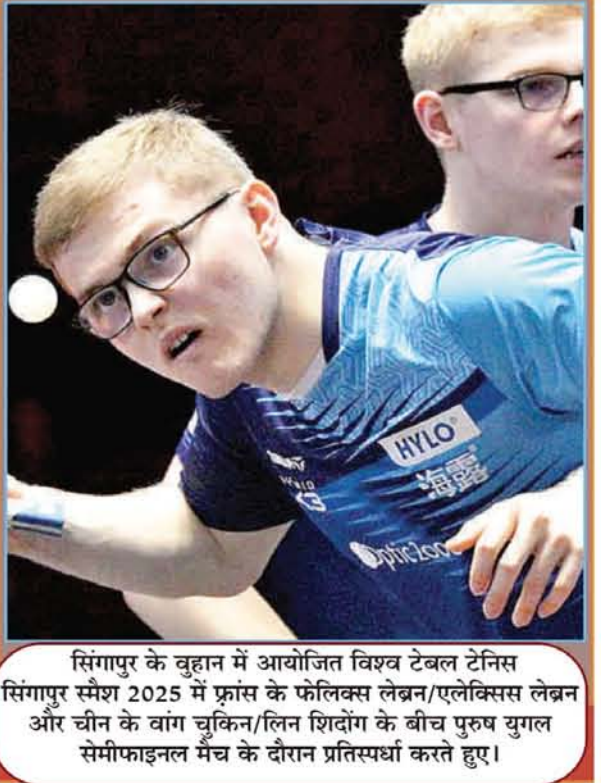
सिंगापुर के वुहान में आयोजित विश्व टेबल टेनिस सिंगापुर स्मेश 2025 में फ्रांस के फेलिक्स लेब्रन/एलेक्सिस लेब्रन और चीन के वांग चुकिन/लिन शिदोंग के बीच पुरुष युगल सेमीफाइनल मैच के दौरान प्रतिस्पर्धा करते हुए।

आरपीसी मीडिया कप के टाइटल स्पॉन्सर टाटा स्टील, को स्पॉन्सर अडानी पावर, मदर जीरामनी टीचर ट्रेनिंग कॉलेज, अलेक्सा रिजॉर्ट एन्ड रेस्टोरेंट, सपॉटिंग पार्टनर टाइटन स्कूल एन्ड जके इंटरनेशनल वूल्ड (जेके क्रिकेट एकेडमी) रहे।