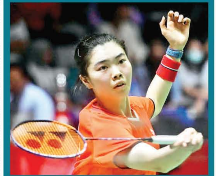
इंडोनेशिया में बैडमिंटन मास्टर्स टूर्नामेंट के महिला वर्ग में गाओ फैंकजी रिटर्न शॉट लगाते हुए।

ऑस्ट्रेलिया में कोहली के खराब प्रदर्शन से गांगुली हैरान हैं। उन्होंने कहा कि पर्थ में शतक लगाने के बाद उन्होंने जिस तरह से बल्लेबाजी की उससे मैं परेशान था। इससे पहले उन्होंने यहां संघर्ष किया था पर पर्थ में शतक के बाद, मैंने सोचा था कि यह उनके लिए एक बड़ी सीरीज होगी पर ऐसा नहीं हुआ। विश्व के हर खिलाड़ी की अपनी कमजोरियां और ताकत होती है। गांगुली ने कहा कि दुनिया में ऐसा कोई खिलाड़ी नहीं है जिसके पास यह नहीं होगा। यह इस चीज के बारे में है कि आप समय के साथ महान गेंदबाजों को खेलते हुए अपनी कमजोरियों को कैसे अनुकूलित करते हैं।