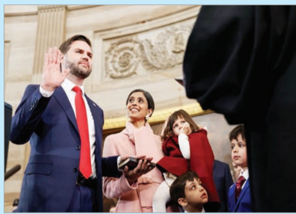
अमेरिका के उपराष्ट्रपति की शपथ लेते जेडी वेंस।

वाशिंगटन (एजेंसी)। अमेरिका के राष्ट्रपति डोनाल्ड ट्रम्प ने शपथ लेते ही अमेरिकी प्रशासन में व्यापक फेरबदल शुरू कर दिया है और कई बड़े फैसले लिए हैं। ट्रंप ने राष्ट्रपति बनने के बाद अपने पहले संबोधन में कहा है कि अमेरिका के 'स्वर्ण युग' का अवतरण आज से हो गया है। उन्होंने अमेरिका में थर्ड जेंडर को अमान्य घोषित कर दिया है। अपने भाषण में 78 वर्षीय ट्रंप ने अगले चार वर्षों के लिए अपना विजन प्रस्तुत किया। ट्रंप ने 20 जनवरी को