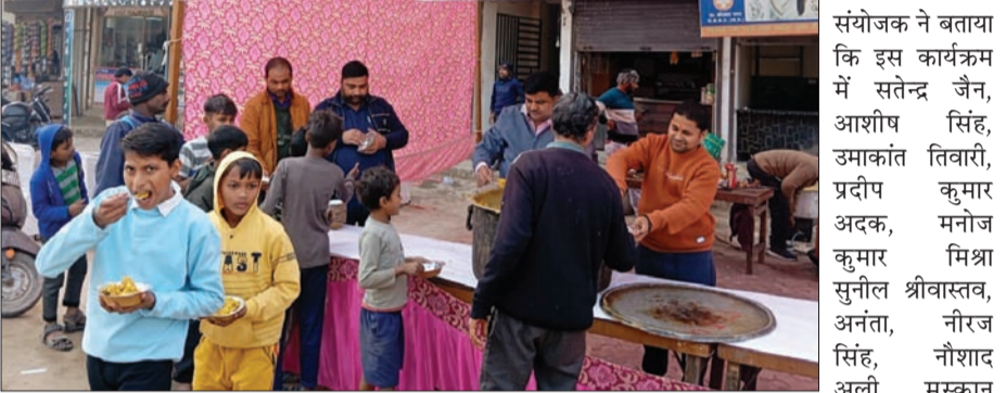
गायत्री वाटिका सोसायटी, सेक्टर 121, पुरता रोड, काली मंदिर के

नोएडा (चेतना मंच)। खिचड़ी महापर्व के अवसर पर