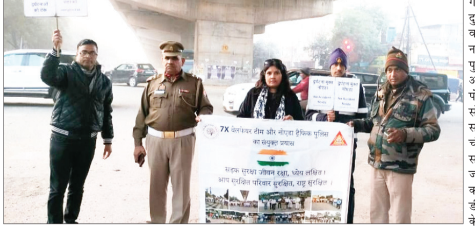
जनवरी महीने में सड़क सुरक्षा माह के तहत जागरूकता अभियान शुरू किया गया है। इसके

नोएडा (चेतना मंच)। सड़क सुरक्षा को बढ़ाने और दुर्घटनाओं पर लगाम लगाने के लिए तहत शहर में जन जागरूकता के लिए अभियान चलाए जा रहे हैं। जिससे सड़क दुर्घटना होने