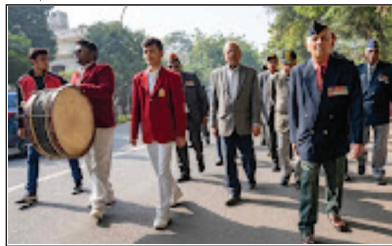
(एवीआरडब्ल्यूए) द्वारा कल वेटरन्स डे मार्च निकाला गया तथा शहीदों को श्रद्धांजलि दी

नोएडा (चेतना मंच)। अरुण विहार गार्ड। यह मार्च वीर सैनिकों और पूर्व सैनिकों के महत्वपूर्ण स्थलों से होकर गुजरा। इनमें शामिल हैं। रेजिडेंट्स वेलफेयर एसोसिएशन को श्रद्धांजलि देने के लिए आयोजित किया करगिल चौक, फोल्ड मार्शल सैम मानिकशॉ एवीआरडब्ल्यूए ने बेहतर इंतजाम के