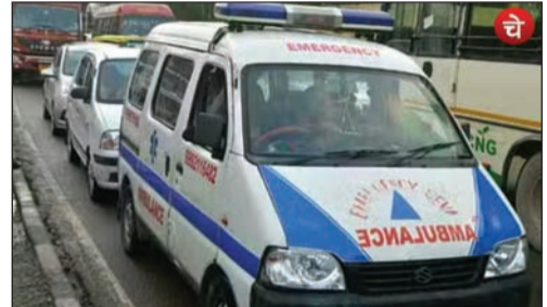
भरोसे चल रही हैं। यह वह एंबुलेंस हैं जिनकी फिटनेस एक्सपायर हो चुकी है और उसके बाद भी बिना फिटनेस टेस्ट कराए इनके संचालक इनका प्रयोग कर रहे हैं। ऐसे में मरीजों के लिए ये खतरे से कम नहीं हैं। कभी भी कोई दुर्घटना इन खराब हो चुकी एंबुलेंस के चक्र में हो सकती है या बीच रास्ते में खराब होने पर सीरियस मरीज की जान भी जा सकती है।

नोएडा (चेतना मंच)। जिले में संचालित 72 एंबुलेंस भगवान