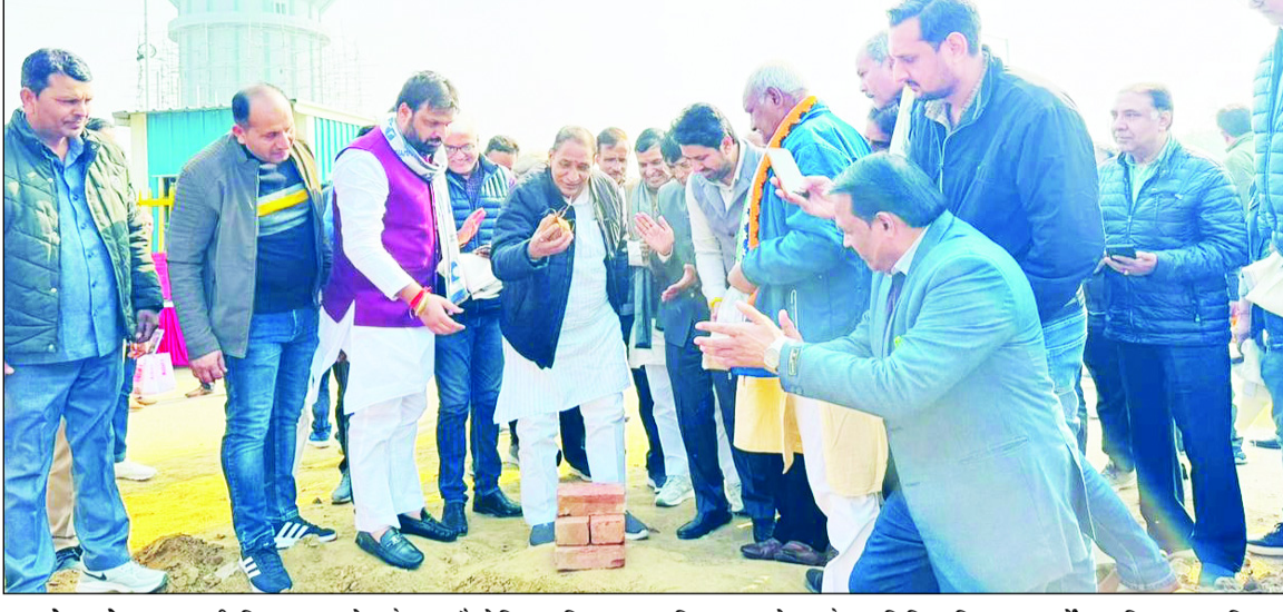
ग्रेटर नोएडा। दादरी विधानसभा क्षेत्र के विधायक तेजपाल नागर ने ग्रेटर नोएडा औद्योगिक विकास प्राधिकरण क्षेत्र के सेक्टर-2 में 524.35 लाख की लागत से विभिन्न विकास कार्यों का शिलान्यास किया। इस अवसर पर उन्होंने क्षेत्र की देवतुल्य जनता

से मुलाकात कर जनसंपर्क किया और जरूरतमंदों को कंबल वितरित किए। विधायक श्री नागर ने कहा कि उनकी सरकार क्षेत्र के चहुंमुखी विकास के लिए प्रतिबद्ध है। इन विकास कार्यों के माध्यम से क्षेत्र के नागरिकों को बेहतर बुनियादी सुविधाएं उपलब्ध कराई जाएंगी। उन्होंने यह भी कहा कि प्रदेश सरकार के नेतृत्व में दादरी विधानसभा क्षेत्र को नई ऊंचाइयों पर ले जाने के लिए लगातार प्रयास किए जा रहे हैं। कार्यक्रम के दौरान बड़ी संख्या में स्थानीय निवासियों ने अपनी उपस्थिति दर्ज कराई और विधायक जी का स्वागत किया। इस अवसर पर क्षेत्र के गणमान्य व्यक्ति, प्राधिकरण के अधिकारी और पार्टी के कार्यकर्ता भी मौजूद रहे। श्री नागर ने जनता को आश्वासन दिया कि विकास कार्यों की गुणवत्ता पर पूरा ध्यान दिया जाएगा और समय पर परियोजनाएं पूरी की जाएंगी। साथ ही उन्होंने जनता से अपील की कि वे स्वच्छता, पर्यावरण संरक्षण, और सामाजिक एकता के प्रति जागरूक रहें।