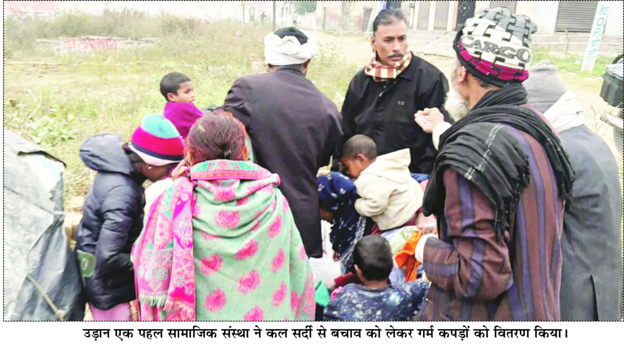
उड़ान एक पहल सामाजिक संस्था ने कल सर्दी से बचाव को लेकर गर्म कपड़ों को वितरण किया।