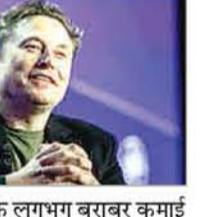
की कमाई के लगभग बराबर कमाई मस्क ने केवल साल 2024 में ही कर ली है। इस साल अब तक मस्क के नेटवर्थ में 245 अरब डॉलर की तेजी रही है। जबकि बेजोस का कुल नेटवर्थ 248 अरब डॉलर ही है। इस साल बेजोस ने भी 70.70 अरब डॉलर अपने नेटवर्थ में जोड़ चुके हैं। इस साल कमाई के मामले में मेटा के सीओ मार्क जुकरबर्ग दूसरे नंबर पर हैं। इनका नेटवर्थ इस साल अलग 86.8 अरब डॉलर बढ़कर 215 अरब डॉलर पर पहुंच गया है।

एजेंसी लास वेगास। स्टेल के प्रमुख एलन मस्क की संपत्ति 474 अरब डॉलर तक पहुंच गयी है। मंगलवार को मस्क की कंपनी के शेयर बढ़ने से उनपर एक प्रकाश से डॉलर की वारिश हुई। ब्लूमबर्ग की रिपोर्ट के अनुसार उनकी संपत्ति एक ही दिन में 22 अरब डॉलर उछल कर 474 अरब डॉलर पर पहुंच गई। अब मस्क 500 अरब डॉलर के आंकड़े से केवल 26 अरब डॉलर दूर है। जिस प्रकार से उनकी कंपनी के शेयर ऊपर जा रहे हैं उससे तब है कि मस्क साल 2024 में ही 500 अरब डॉलर के मुकाम तक पहुंच जाऐं। मंगलवार 24 दिसंबर को टेस्ला के शेयरों में आए 7.35 फीसदी उछाल से उनके शेयर में जबरदस्त उछाल है। अमेजन के मालिक जेफ बेजोस की जीवन भर की कमाई के लगभग बराबर कमाई मस्क ने केवल साल 2024 में ही कर ली है। इस साल अब तक मस्क के नेटवर्थ में 245 अरब डॉलर की तेजी रही है। जबकि बेजोस का कुल नेटवर्थ 248 अरब डॉलर ही है। इस साल बेजोस ने भी 70.70 अरब डॉलर अपने नेटवर्थ में जोड़ चुके हैं। इस साल कमाई के मामले में मेटा के सीओ मार्क जुकरबर्ग दूसरे नंबर पर हैं। इनका नेटवर्थ इस साल अलग 86.8 अरब डॉलर बढ़कर 215 अरब डॉलर पर पहुंच गया है।