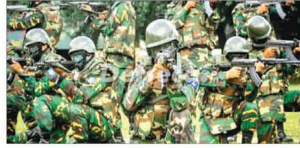
डॉक्ट्रिन कमांड (एटीडीसी) मुख्यालय में शुरू होगा और पूरे एक साल तक चलेगा। इसके बाद पाकिस्तानी सेना बांग्लादेश की सभी 10 सैन्य कमांड्स में प्रशिक्षण देने का काम करेगी। शोध हसीना के तत्वावधान में पाकिस्तान खुश: दरअसल पूर्व की शोध हसीना सरकार ने पाकिस्तान के साथ संबंधों को सीमित रखा था, लेकिन उनकी विदाई के बाद अंतरिम सरकार ने पाकिस्तान से नजदीकियां बढ़नी शुरू कर दी है। बांग्लादेश ने फरवरी 2025 में कराची में होने वाले पाकिस्तान सैनिकों के साथ सैन्य अभ्यास ह्वामन-2025 में हिस्सा लेने की सहमति दी है। जहां 2022

ढाका। 1971 में जिस पाकिस्तानी सेना को पूर्वी पाकिस्तान से खदेड़कर बांग्लादेश का निर्माण हुआ था, वही सेना अब 53 साल बाद बांग्लादेश में सैन्य प्रशिक्षण देने वाली है। यह घटनाक्रम भारत के लिए एक बड़ी चुनौती और सामरिक चिंता का कारण बना गया है। दरअसल बांग्लादेश की अंतरिम सरकार ने पाकिस्तानी सेना के साथ रणनीतिक और सैन्य संबंध मजबूत करने में जुटी है। पाकिस्तानी सेना के ज्वाइंट चीफ ऑफ स्टाफ कमेटी के चेयरमैन जनरल साहिर मशहद मिर्जा की अगुआई में एक विशेष टीम फरवरी 2025 में बांग्लादेश आ रही है। यह प्रशिक्षण मेमनशाही कैट थिंथ आर्मी ट्रेनिंग एंड