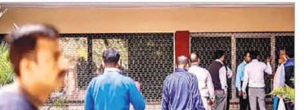
दौरान 18-25 आयु वर्ग का दबदबा रहा है, जो अक्टूबर 2024 में जोड़े गए कुल नए सदस्यों का 58.49 फीसदी है। ईपीएफओ के अक्टूबर 2024 के लिए जारी आंकड़ों से चलता है कि लगभग 12.90 लाख सदस्य ईपीएफओ से बाहर निकल गए और बाद में फिर से जुड़ गए। इस दौरान जोड़े गए नए सदस्यों में से करीब 2.09 लाख नए महिला सदस्य हैं। ये आंकड़ा अक्टूबर 2023 की तुलना में 2.12 फीसदी की साल-दर-साल वृद्धि को दर्शाता है। हालांकि, अक्टूबर महीने के दौरान शुद्ध महिला सदस्य जुड़ाव करीब 2.79 लाख रहा, जो महिला सदस्यों में वृद्धि अधिक समावेशी और विविध कार्यबल की ओर व्यापक बदलाव का संकेत है। मंत्रालय ने कहा कि ईपीएफओ के जारी पैरोल डेटा के राज्यवार विश्लेषण से पता चलता है कि टॉप 5 राज्यों और केंद्र शासित प्रदेशों में शुद्ध सदस्य वृद्धि कुल सदस्य वृद्धि का करीब 61.31 फीसदी है।

एजेंसी नई दिल्ली। कर्मचारी भविष्य निधि संगठन (ईपीएफओ) ने अक्टूबर महीने में शुद्ध रूप से 13.41 लाख सदस्य जोड़े हैं। इस दौरान ईपीएफओ ने अपने साथ 7.50 लाख नए सदस्यों को जोड़े हैं। यह रोजगार के अवसरों में वृद्धि और कर्मचारी लाभों के बारे में बढ़ती जागरूकता को दर्शाता है। श्रम एवं रोजगार मंत्रालय ने बुधवार को जारी एक बयान में कहा कि ईपीएफओ ने अक्टूबर 2024 में नेट 13.41 लाख सदस्यों को जोड़ा है। इस दौरान ईपीएफओ से 7.50 लाख नए सदस्य जुड़े हैं। ईपीएफओ के जारी आंकड़ों के मुताबिक इस अवधि में 18-25 आयु वर्ग के जोड़े हुए कुल नए सदस्यों की संख्या 5.43 लाख है। आंकड़ों के मुताबिक अक्टूबर के