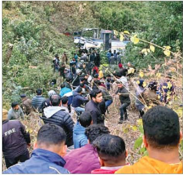
परिचालन केंद्र और नैनीताल जिले की पुलिस ने इस हादसे में तीन लोगों की मौत और 25 के घायल होने की पुष्टि की है। घटना

देहरादून। उत्तराखंड के नैनीताल जिले में बुधवार को एक बड़ा सड़क हादसा हुआ। अल्मोड़ा से हल्द्वानी जा रही उत्तराखंड राज्य सड़क परिवहन निगम की बस भीमताल-रानीबाग मोटर मार्ग पर आमडाली के पास करीब 100 मीटर गहरी खाई में गिर गई। हादसे में तीन यात्रियों की मौत हो गई जबकि 25 गंभीर रूप से घायल हो गए। यह हादसा अपराह्न करीब 3 बजे हुआ। बस में 28-29 यात्री सवार थे, जिनमें से अधिकांश नर्सिंग छात्राएं बताई जा रही हैं। राज्य आपातकालीन