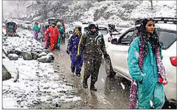
बताया कि प्रदेश के किन्नौर, लाहौल एवं स्पीति, शिमला, कुल्लू, मंडी, चंबा और सिरमौर जिले के ऊंचे इलाकों में बर्फबारी हुई। जानकारी में बताया कि शिमला के होटल में 70 प्रतिशत कमरे भरें हैं। उन्होंने बताया कि बर्फबारी के कारण कमरों की बुकिंग में 30 प्रतिशत की वृद्धि हुई है। अतिरिक्त मुख्य सचिव

शिमला। हिमाचल प्रदेश में बीते दो रोज से लगातार बर्फबारी का दौर जारी है। शिमला के नारकंडा, मनाली की अटल टनल सहित ऊंचाई वाले इलाकों में बर्फबारी हो रही है। अटल टनल के पास मंगलवार रात को भी बर्फ गिरी है। इसके बाद अटल टनल को सैलानियों के लिए बंद किया गया है। मनाली के सोलांग तक ही सैलानियों की आवाजाही हो रही है। फिलहाल, आगे बर्फबारी अधिक हुई है। उधर, बर्फबारी के चलते तीन नेशनल हाइवे सहित राज्य में 233 सड़कें बंद हैं। हिमाचल सरकार के अधिकारियों ने इसकी जानकारी दी। अधिकारियों ने