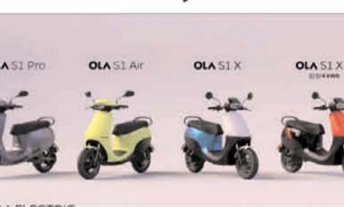
सुविधाओं के साथ जुड़े हुए हैं। ऐसा कर कंपनी ने टियर-1 और टियर-2 शहरों के अलावा छोटे छोटे कस्बों और तहसीलों तक अपनी पहुंच को बढ़ा दिया है। वहीं ईवी नेटवर्क के विस्तार के साथ ओला इलेक्ट्रिक ने अपने सर्विंग वाला स्कूटर अभियान के तहत किए गए वादे को पूरा कर दिया है। भविष्य अग्रवाल ओला इलेक्ट्रिक के चेयरमैन और मैनेजिंग

एजेंसी रांची। ओला इलेक्ट्रिक जो भारत की सबसे बड़ी ईवी कंपनी के नाम से जानी जाती है, उसने आज अपने नेटवर्क को 4,000 स्टोर्स तक बढ़ाने की घोषणा करी, जो मौजूदा नेटवर्क से चार गुना ज्यादा है। यह दुनिया में ईवी नेटवर्क के सबसे बड़े विस्तारों में से एक माना जा रहा है, इस विस्तार से यकनिन देश में ईवी तक लोगों की पहुंच आसान हो जाएगी और ईवी के क्षेत्र में बहुत बड़ा विकास होने की संभावनाएं भी काफी हद तक बढ़ जाएंगी साथ ही ईवी के प्रति भरोसा और उसे अपनाने को मजबूती भी मिलेगी। कंपनी ने बड़े पैमाने पर ईवी अपनाने की अपनी प्रतिबद्धता के चलते 3,200 से भी ज्यादा नए स्टोर्स को लॉन्च किया है, जो सर्विस