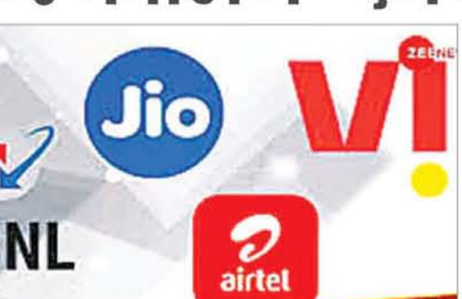
डेटा नहीं चाहिए होता है, उन्हें भी डेटा के लिए भुगतान करना पड़ता है। इस तरह का प्लान ना होने की वजह से जियो, एयरटेल और वोडाफोन आइडिया के यूजर्स को अपना सिम एक्टिव रखने के लिए हर महीने करीब 200 रुपए खर्च करने होते हैं। वहीं कुछ ऐसे यूजर्स भी हैं, जिन्हें लॉन्ग टर्म प्लान्स चाहिए होता है। आपको ऐसा लॉन्ग टर्म प्लान नहीं मिलेगा, जो सिर्फ कॉलिंग और एमएसएस पर फोकस

एजेंसी नई दिल्ली। जियो, एयरटेल, वोडाफोन आइडिया और बीएसएनएल यूजर्स को जल्द ही सस्ते रिचार्ज का ऑप्शन मिल सकता है। टेलीकॉम रेगुलेटरी अथॉरिटी ऑफ इंडिया (ट्राई) ने सभी टेलीकॉम ऑपरेटर्स से कंज्यूमर्स के लिए कॉलिंग और एमएसएस फोकस प्लान्स लॉन्च करने के लिए कहा है, जिसमें वैलिडिटी भी मिलती हो। टेलीकॉम ऑपरेटर्स के पोटफोलियो पर नजर डालें तो इसमें सभी प्लान्स डेटा पर फोकस मिलते हैं यानी इसमें कॉलिंग, एमएसएस और डेटा तीनों मिलता है। ऐसे में कई यूजर्स जिन्हें