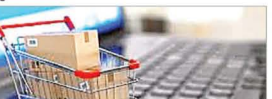
ई-कॉमर्स जानकारी प्रदान करता है और उन्हें सचेत करता है कि कोई यूआरएल असुरक्षित हो सकता है और सावधानी बरतने की आवश्यकता है। वहीं, जागुति ऐप यूजर्स को उन यूआरएल की रिपोर्ट करने में मदद करता है, जहां उन्हें उन एक या अधिक डाक फर्मा के उपरिस्थिति का संदेह है, जिन्हें अवैध घोषित किया गया है। जागो ग्राहक जागो ऐप उपभोक्ता को ई-कॉमर्स प्लेटफॉर्म के बारे में महत्वपूर्ण जानकारी प्रदान करता है, जिससे वे

एजेंसी नई दिल्ली। उपभोक्ता मामलों के विभाग ने उपभोक्ता संरक्षण को बढ़ावा देने और ग्राहक ऑनलाइन प्रथाओं से निपटने के लिए नए ऐप लॉन्च किए। ये ऐप डिजिटल उपभोक्ताओं को सशक्त बनाने और ई-कॉमर्स में उभर रही चुनौतियों से निपटने में मदद करेंगे। ये नए उपाय सरकार की उपभोक्ता संरक्षण और डिजिटल परिवर्तन के प्रति प्रतिबद्धता दिखाते हैं। इन ऐप के माध्यम से केंद्रीय उपभोक्ता संरक्षण प्राधिकरण की क्षमता काफी बढ़ जाएगी और उसे डाक फर्मा के खिलाफ स्वतः संज्ञान लेकर ग्राहकों की रक्षा करने में सहायता मिलेगी। जागो ग्राहक जागो ऐप उपभोक्ता की ऑनलाइन गतिविधियों के दौरान सभी यूआरएल के बारे में आवश्यक