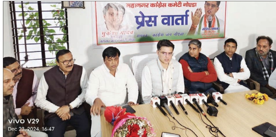
vivo V29 Dec 23, 2024, 16:47

आगामी दो दिनों तक जहां जहां अंबेडकर भवन हैं वहां से कांग्रेस कार्यकर्ता बाबा साहब को