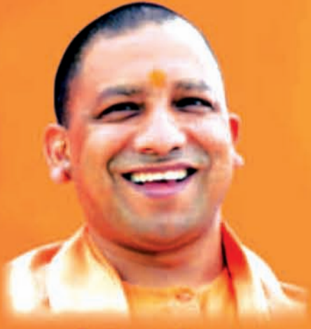
योगी आदित्यनाथ मुख्यमंत्री, उत्तर प्रदेश