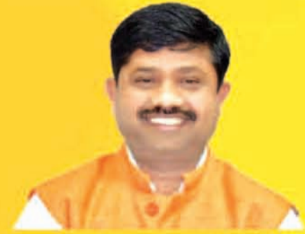
नन्द कुमार गुप्ता 'नन्दी' केबिनेट मंत्री, औद्योगिक विकास, उत्तर प्रदेश