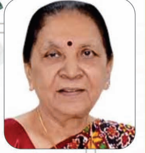
श्रीमती आनंदीबेन पटेल महामहिम राज्यपाल उत्तर प्रदेश