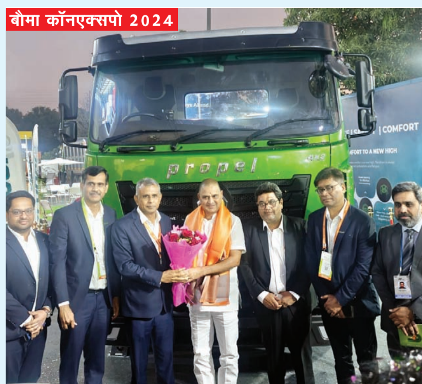
बौमा कॉनएक्सपो 2024

उन्होंने बताया कि इसमें 350 किलोवाट की शक्तिशाली इलेक्ट्रिक मोटर लगी है, जो 2600 न्यूटनमीटर का टॉर्क उत्पन्न करती है। इस ट्रक में आधुनिक ड्राइवर असिस्टेंस सिस्टम, जैसे एबीएस, ईबीएस, ईएससी, एचएसए, और ट्रेक्शन कंट्रोल दिए गए हैं, ताकि ड्राइविंग और कंट्रोलिंग का सुरक्षित अनुभव प्राप्त हो।