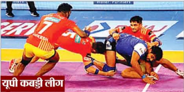
यूपी कबड्डी लीग

लखनऊ। उत्तर प्रदेश कबड्डी लीग (यूपीकेएल) 2024 सीजन 1 की शानदार सफलता के बाद, लीग के आयोजक सीजन 2 में चार और नई फ्रेंचाइजी लाने की योजना बना रहे हैं। यूपीकेएल का उद्घाटन समारोह जुलाई 2024 में नोएडा इंडोर स्टेडियम में आयोजित किया गया था। पहले सीजन में चौपिनशिप खिलाड़ियों के लिए कुल आठ टीमों यमुना वॉरियर्स, नोएडा निन्जा, काशी क्रिकर्स, अवध रामदूत, ब्रिज स्टार, संगम चैलेंजर्स, अयोध्या वॉरियर्स, गंगा क्रिकर्स ऑफ मिर्जापुर और लखनऊ लॉयर्स ने खूब पसंदी बहाया था। जिसमें लखनऊ लॉयर्स ने खिताब अपने नाम किया था। यूपीकेएल के आयोजक संभव जैन