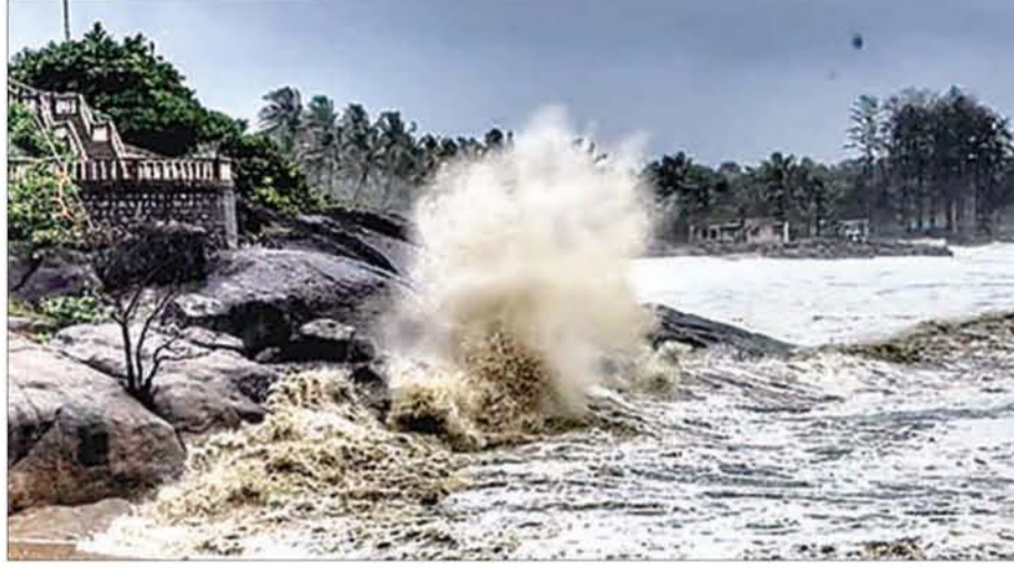
ओर वाहन भी क्षतिग्रस्त हुए हैं। कोलकाता और भुवनेश्वर एयरपोर्ट पर फ्लाइट की आवाजाही फिर से शुरू हो गई है। कोलकाता से पहली फ्लाइट सुबह 8:40 बजे रवाना हुई। रेलवे ने बताया कि रद्द ट्रेनों को छोड़कर ओडिशा और पश्चिम बंगाल जाने वाली बाकी सभी ट्रेनों

एजेंसी नई दिल्ली। बंगाल की खाड़ी से उठे चक्रवाती तूफान दाना गुरुवार तट ओडिशा के तट से 110 किमी प्रति घंटे की रफ्तार से टकराया। तूफान की लैंडफॉल प्रक्रिया सुबह करीब 8:30 बजे खत्म हुई, जिसके बाद इसकी रफ्तार घटकर 10 किमी प्रति घंटे रह गई। तूफान दाना के असर से ओडिशा में बारिश जारी है और भद्रक व केद्रपाड़ा जैसे क्षेत्रों में 30 सेंटीमीटर से ज्यादा बारिश की संभावना है। ओडिशा के सीएम मोहन चरण माझी ने बताया कि 5.84 लाख लोगों को राहत कैंपों में शिफ्ट किया गया है। तूफान से कई इलाकों में पेड़ उखड़ गए