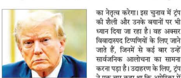
इसका खंडन किया था, यह स्पष्ट करते हुए कि यह एक द्विपक्षीय मुद्दा है और किसी तीसरे पक्ष के लिए इसमें कोई जगह नहीं है। अमेरिकी चुनाव में ट्रंप और हैरिस के बीच प्रतिस्पर्धा न केवल नीतियों पर आधारित है, बल्कि दोनों के व्यक्तिगत बयानों और छवि पर भी निर्भर करेगी। चुनाव के नतीजे को प्रभावित करने वाले कई कारक होंगे, और समय ही बताएगा कि कौन अगले चार वर्षों के लिए देश का नेतृत्व करेगा। इस चुनाव में ट्रंप को शैली और उनके बयानों पर भी ध्यान दिया जा रहा है। वह अक्सर विवादास्पद टिप्पणियों के लिए जाने जाते हैं, जिनमें से कई बार उन्हें सार्वजनिक आलोचना का सामना करना पड़ा है। उदाहरण के लिए, ट्रंप ने एक बार कहा था कि अमेरिका में विदेशी लोगों पर कुत्तों को मारकर खाने का आरोप लगाया, जिससे उन्हें काफी किरकिरी का सामना करना पड़ा था हालांकि, यह भी सच है कि उनके ऐसे बयानों ने वाइट पंपुलेशन के बीच उन्हें समर्थन भी दिलाया है। दूसरी ओर, कमला हैरिस ने इस मुद्दे का उपयोग कर प्रवासियों के प्रति सहानुभूति दिखाने का प्रयास किया है, जिससे वह इस समूह को अपने पक्ष में लाने में सफल रही हैं।

एजेंसी वाशिंगटन। अमेरिका में 5 नवंबर को राष्ट्रपति चुनाव होने जा रहे हैं, जिसमें डोनाल्ड ट्रंप और कमला हैरिस के बीच कड़ी प्रतिस्पर्धा देखने को मिल रही है। हालिया सर्वेक्षणों के अनुसार, ट्रंप वर्तमान में हैरिस से मामूली बढ़त बनाए हुए हैं। नेशनल सर्वे में ट्रंप को 47 प्रतिशत और हैरिस को 45 प्रतिशत वोट मिलने की संभावना जताई गई है। वहीं, सीएनबीसी ऑल-अमेरिका इकोनॉमिक सर्वे में ट्रंप को 48 प्रतिशत और हैरिस को 46 प्रतिशत के साथ ट्रंप के पक्ष में 3.1 प्रतिशत का मार्जिन ऑफ एरर दर्ज किया गया है। इसके अलावा, ट्रंप ने जब कश्मीर मुद्दे पर भारत के प्रधानमंत्री नरेंद्र मोदी का जिम्मेदार किया था, तब भारत ने तुरंत