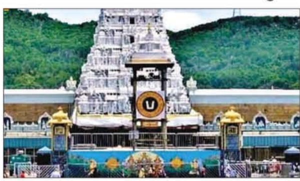
बाद पुलिस ने इन होटलों में गहन तलाशी अभियान शुरू किया, जिसमें बम निरोधक दस्ते और खोजी कुत्तों की मदद ली गई। अधिकारियों ने बताया कि यह धमकी मात्र एक अफवाह थी, लेकिन पुलिस ने एहतियात के तौर पर सुरक्षा बढ़ा दी है और धमकी देने वाले का पता लगाने के लिए