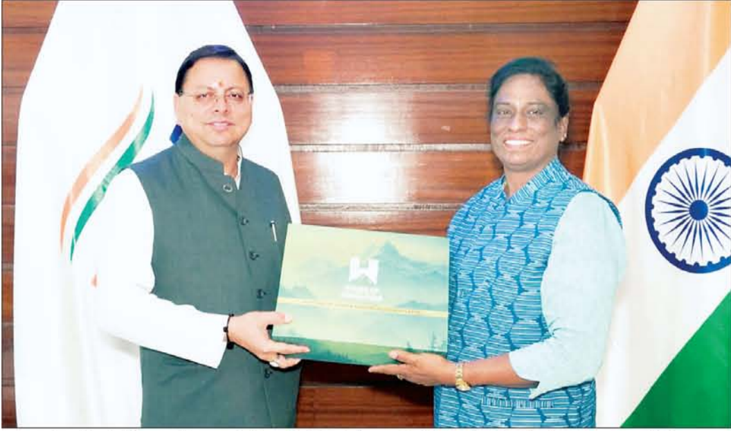
बुधवार को भारतीय ओलंपिक संघ की अध्यक्ष पी टी उषा ने नई दिल्ली में उत्तराखंड में होने वाले 38वें राष्ट्रीय खेल-2025 पर घर्षा के लिए उत्तराखंड के मुख्यमंत्री पुष्कर सिंह धामी से मुलाकात की।