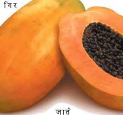
गिर जाते हैं।

यह पपीते के फल का प्रमुख रोग है। इसके कई कवक कारक हैं जिसमें कोलेटोट्रोईकम ग्लियोस्पोराइडस प्रमुख है। अध पके एवं पके फल रोगी होते हैं। इस रोग में फलों के उपर छोटे गोल गीले धब्बे बनते हैं। बाद में ये बढ़कर आपस में मिल जाते हैं तथा इनका रंग भूरा या काला हो जाता है। यह रोग फल लगने से लेकर पकने तक लगता है जिसके कारण फल पकने से पहले ही गिर जाते हैं।