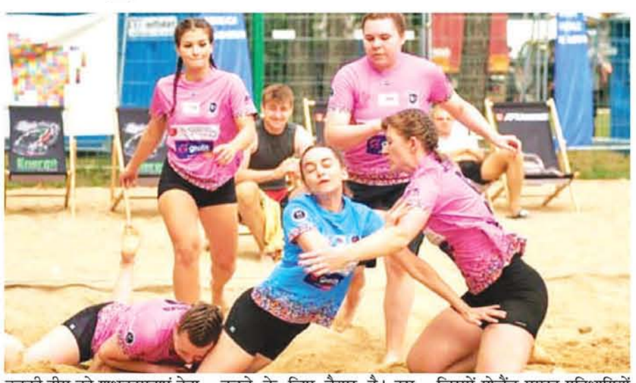
उनकी टीम को शुभकामनाएं देना चाहता है। भारत राष्ट्रीय राजधानी क्षेत्र में होने वाले एक अभूतपूर्व टूर्नामेंट जीपीकेएल की मेजबानी करने के लिए तैयार है। इस आयोजन में अपने पहले सत्र में 15 से अधिक देशों की महिला कबड्डी खिलाड़ी हिस्सा लेंगी, जिनमें पोलैंड प्रमुख प्रतिभागियों में से एक है। पोलैंड के अलावा इस प्रतियोगिता में इंग्लैंड, अर्जेंटीना, कनाडा और इटली

एजेंसी नई दिल्ली। भारत में आगामी ग्लोबल प्रवासी महिला कबड्डी लीग (जीपीकेएल) में प्रतिस्पर्धा करने के लिए तैयार पोलिश खिलाड़ियों ने अपनी भागीदारी को लेकर काफी उत्साह व्यक्त किया है। पिछले सप्ताह, प्रधानमंत्री मोदी दोनों देशों के बीच राजनयिक संबंधों की 70वीं वर्षगांठ मनाने के लिए पोलैंड में थे। अपने मुख्य भाषण के दौरान, उन्होंने कबड्डी को दोनों देशों के बीच एक साझा सूत्र बताया था। प्रधानमंत्री मोदी ने अपने संबोधन में कहा था, रहम कबड्डी के खेल के माध्यम से जुड़े हुए हैं। यह खेल भारत के माध्यम से पोलैंड पहुंचा और उन्होंने इसे बहुत ऊंचाई पर पहुंचाया। पोलैंड पहली बार कबड्डी चैंपियनशिप की मेजबानी करने जा रहा है।