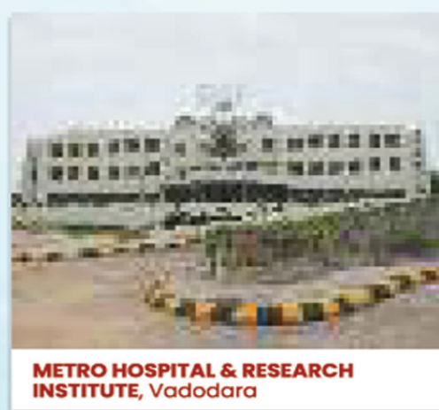
METRO HOSPITAL & RESEARCH INSTITUTE, Vadodara