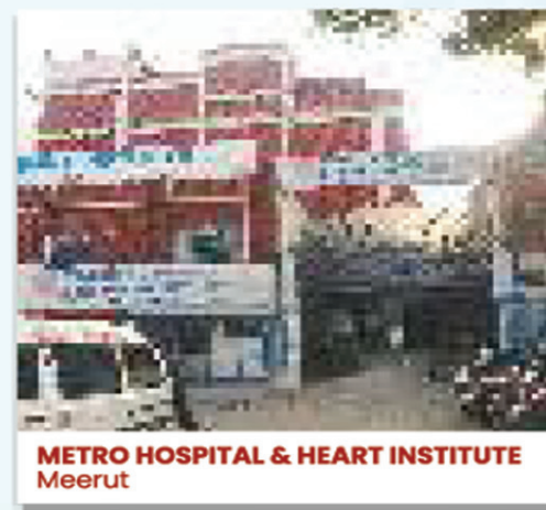
METRO HOSPITAL & HEART INSTITUTE Meerut