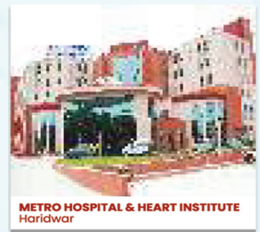
METRO HOSPITAL & HEART INSTITUTE Haridwar