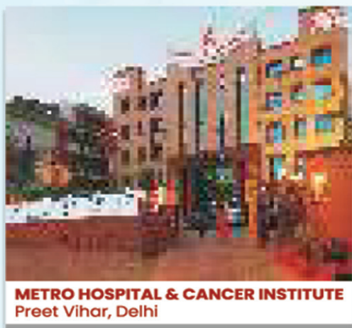
METRO HOSPITAL & CANCER INSTITUTE Preet Vihar, Delhi