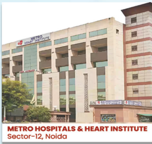
METRO HOSPITALS & HEART INSTITUTE Sector-12, Noida

25 YEARS | OVER 600+ DOCTORS 2500+ OPERATIONAL BEDS | 20 LAC+ PATIENTS | 11 HOSPITALS A REPUTED NURSING, PHARMACY & PARAMEDICAL COLLEGE