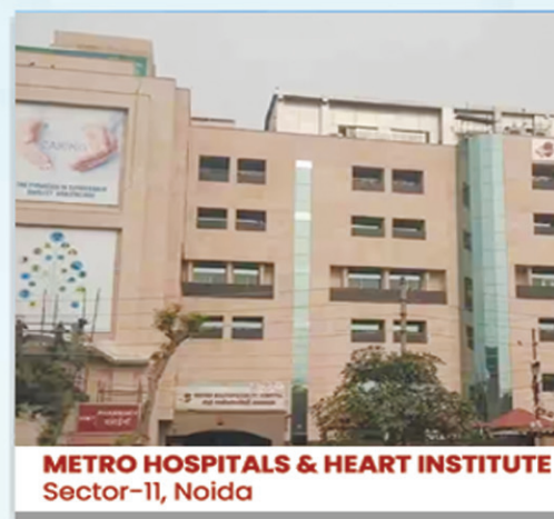
METRO HOSPITALS & HEART INSTITUTE Sector-11, Noida