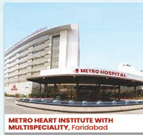
METRO HEART INSTITUTE WITH MULTISPECIALTY, Faridabad