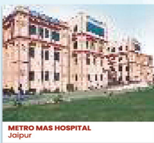
METRO MAS HOSPITAL Jaipur