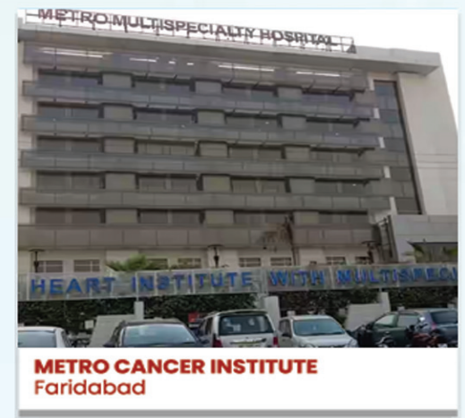
METRO CANCER INSTITUTE Faridabad