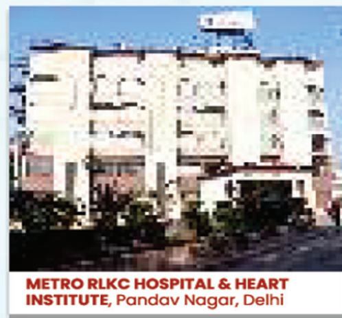
METRO RLKC HOSPITAL & HEART INSTITUTE, Pandav Nagar, Delhi