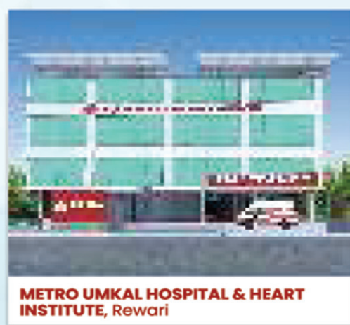
METRO UMKAL HOSPITAL & HEART INSTITUTE, Rewari