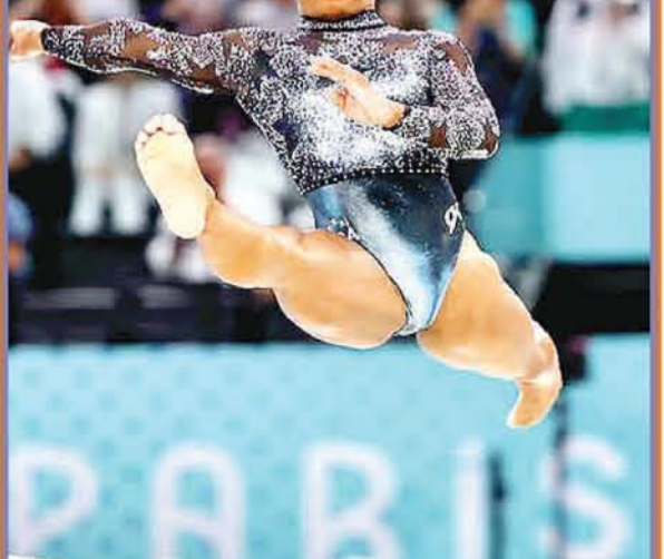
पेरिस ओलंपिक में बेलेंस बीम पर अमेरिका की महिला जिम्नास्ट शिमोन बाइन्स करतब दिखाती हुईं