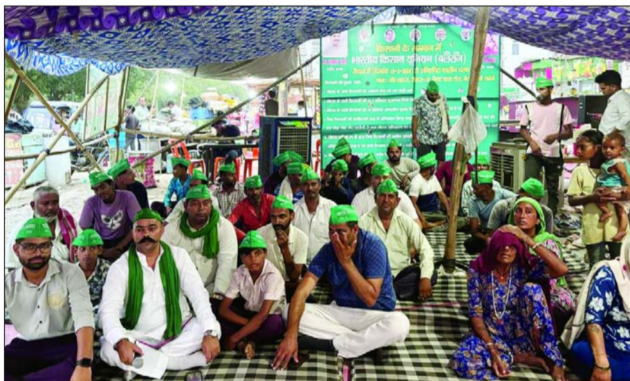
भारतीय किसान यूनियन बलराज संगठन के बैनर तले अनिश्चित कालीन धरना सेक्टर-142 नोएडा शहदरा गांव में 122वें दिन भी जारी रहा।