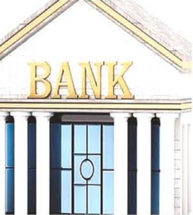
बढ़कर 1.7 लाख करोड़ पहुंच गया, जो कुल मुनाफे का 54.83 फीसदी है।