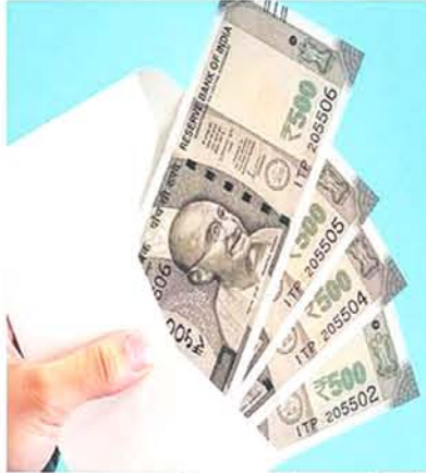
यह 2022-23 की तुलना में 34 फीसदी अधिक है। निजी बैंकों का मुनाफा 42 फीसदी

नई दिल्ली, एजेंसी। बैंलेसशोर्ट में सुधार के दम पर देश के बैंकिंग क्षेत्र ने पहली बार तीन लाख करोड़ रुपये से ज्यादा का मुनाफा कमाया है। सरकारी और निजी बैंकों का लाभ सालाना आधार पर 40.90 फीसदी बढ़कर 2023-24 में 3.1 लाख करोड़ रुपये पहुंच गया। 2022-23 में यह 2.2 लाख करोड़ रुपये रहा था। खास बात है कि बीते वित्त वर्ष में बैंकों ने आईटी कंपनियों से ज्यादा मुनाफा कमाया है। तीन लाख करोड़ रुपये का यह अंकड़ों मोटे तौर पर बीते वित्त वर्ष की शुरुआती तीन तिमाहियों के दौरान सभी सूचीबद्ध कंपनियों के मुनाफे के बराबर है। 2023-24 में सूचीबद्ध आईटी सेवा कंपनियों का शुद्ध लाभ करीब 1.1 लाख करोड़ रुपये रहा है।