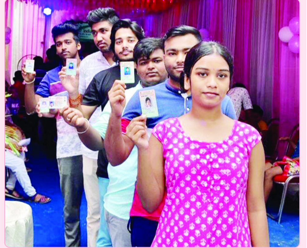
लोकसभा चुनाव-2024 के पांचवें चरण में देश के आठ राज्यों में वोटिंग चल रही है। उत्तर प्रदेश की 14 लोकसभा सीटों पर आज मतदान हो रहा है। मतदान को लेकर आम जनता में भारी उत्साह देखा जा रहा है। युवाओं से लेकर बुजुर्गों तक व महिलाएं बड़ी संख्या में वोट देने के लिए पहुंच रही हैं।