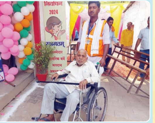
अयोध्या में एक बुजुर्ग वोटर ने व्हीलचेयर से आकर वोट डाला

लखनऊ में वोट डालने के बाद बसपा सुप्रीमो मायावती ने कहा मैंने मतदान कर दिया है... मैं सभी मतदाताओं से अपील करती हूँ कि मतदान जरूर करें। मैं सभी राजनीतिक दलों से कहना चाहती हूँ कि उनको जनहित के मुद्दों को प्राथमिकता देनी चाहिए।