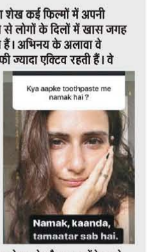
Namak, kaanda, tamaatar sab hai.

फा तिमा सना शेख कई फिल्मों में अपनी अदाकारी से लोगों के दिलों में खास जगह बना चुकी हैं। अभिनय के अलावा वे सोशल मीडिया पर भी काफी ज्यादा एक्टिव रहती हैं। वे अक्सर इंस्टाग्राम पर अपने प्रशंसकों के सवालों का बेबाकी से जवाब देती नजर आती हैं। हाल ही में अभिनेत्री अपने फैंस के लिए आरक-मी-एनीथिंग (एमएमए) सत्र का आयोजन किया। इस दौरान उन्होंने कई सवालों के खुलकर जवाब दिए। इस सेशन के दौरान उन्होंने अपने आगामी प्रोजेक्ट मेट्रो इन दिनों और उल जलूल के पर्दे के पीछे की तरकीबें साझा कर फैंस को बड़ी सीगात दे डाली। अभिनेत्री की ओर से आयोजित किया गया यह सत्र काफी ज्यादा मनोरंजक सवालों से भरपूर रहा। अभिनेत्री ने इन सवालों के बखूबी जवाब भी दिया। अपने पसंदीदा एनीमे चरित्र पर चर्चा करने से लेकर अपनी यात्रा को एक शब्द में संक्षेप में बताने तक, उन्होंने लोगों से अपने संवाद को हल्का-फुल्का और मजेदार बनाए रखा। एक यूजर ने उनसे सवाल किया कि क्या आपके टूथपेस्ट में नमक है? जिस पर अभिनेत्री के जवाब ने फैंस को हंसा-हंसाकर लोटपोट कर दिया। अभिनेत्री ने जवाब में कहा, "नमक, कांदा और टमाटर सब है।" वक फ्रंट की बात करते तो फातिमा को बड़े पर्दे पर आखिरी बार साल 2023 में रिलीज हुई फिल्म सैम बहादुर में देखा गया था। इस फिल्म में वे इंदिरा गांधी के किरदार में नजर आई थीं।