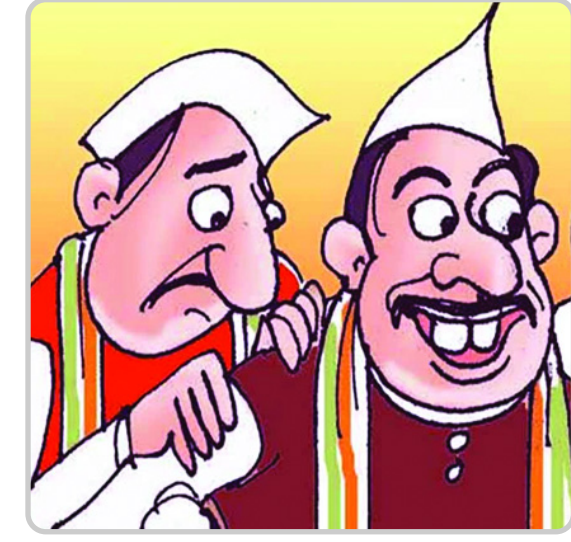
लोग अपनी जाति के लोगों को अपनी ओर खींचने के लिए उस गंध का इस्तेमाल करते हैं। और जैसे ही वे उन्हें अपने बनाते हैं, उनका सीना गर्व से फूल जाता है। यह गंध इतनी शक्तिशाली होती

को अपनी ओर आकर्षित करने में सक्षम होते हैं। जातीय गंध में इतनी आकर्षण शक्ति होती है कि उससे कुछ भी हो सकता है।