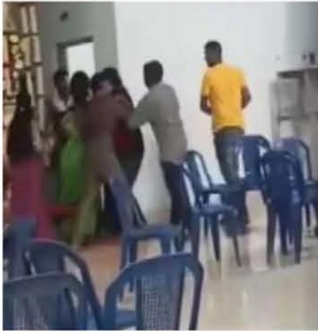
जा रहा है कि दुल्हन के घरवाले शादी के विरोध में थे। इसलिए वह भागकर अपने पसंद के लड़के से शादी कर रही थी। घटना 21 अप्रैल की है। लड़की ने 13 अप्रैल

घरवाले और दोस्त इस कोशिश को नाकाम कर देते हैं। बताया जा रहा है कि दुल्हन का किडनैपिंग का प्रयास किसी और ने नहीं, उसके चचेरे भाइयों ने किया। बताया