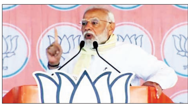
मतदान हो रहा है। ये लोकतंत्र के सबसे बड़े उत्सव का बहुत बड़ा दिन है। मेरा सभी मतदाताओं से अनुरोध है कि संविधान से मिले इस अधिकार का उपयोग जरूर करें। और विशेषकर मैं अपने युवाओं से आग्रह करूंगा, जो पहली बार वोट डालने जा रहे हैं कि वे ऐसा मौका जाने न दें, वो अवश्य वोट करें। (शेष पृष्ठ-4 पर)

अमरौहा (एजेंसी)। लोकसभा चुनाव 2024 के पहले चरण के बीच प्रधानमंत्री नरेंद्र मोदी ने आज गजरौला में अमरौहा लोकसभा सीट से भाजपा प्रत्याशी कंवर सिंह तंवर के समर्थन में जनसभा को संबोधित किया। इस दौरान जहां सपा-कांग्रेस पर जमकर हमला बोला। पीएम मोदी ने कहा कि प्रदेश में दो शहजादों की जोड़ी घूम रही है, उनकी फिल्म शूटिंग चल रही। वह हमारी आस्था से खिलवाड़ कर रहे हैं। प्रधानमंत्री नरेंद्र मोदी ने जनसभा को संबोधित करते हुए कहा कि आज पहले चरण का