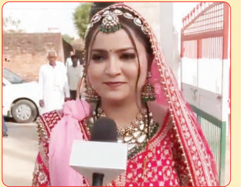
लोकसभा चुनाव के पहले चरण में अपना वोट डालने के लिए मुजफ्फरनगर में मतदान केंद्र संख्या 193-194 पर एक दुल्हन पहुंची। दुल्हन ने कहा कि चुनाव में वोट डालना हर नागरिक का अधिकार है।