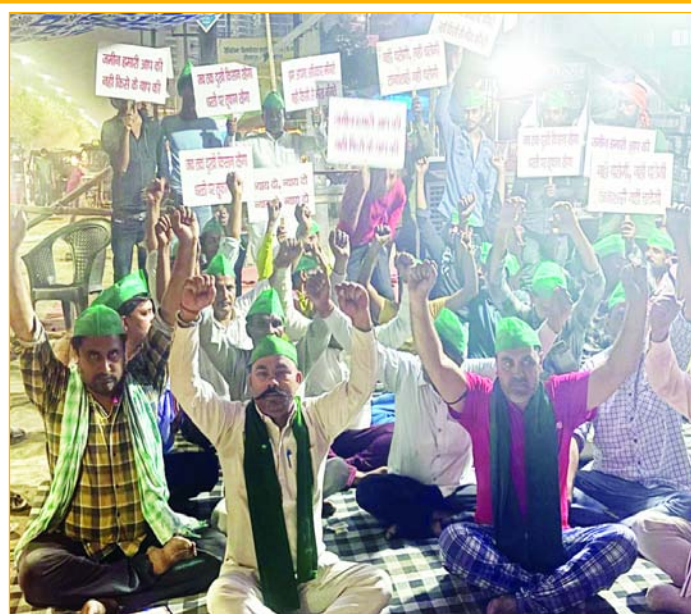
भारतीय किसान यूनियन बलराज संगठन के बैनर तले अनिश्चित कालीन धरना सेक्टर-142 नोएडा शहरा गांव में आज 66वें दिन भी जारी रहा