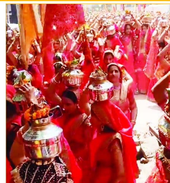
सलारपुर में आयोजित श्री राम कथा के पर्व कल कलश यात्रा में शामिल महिलाएं।