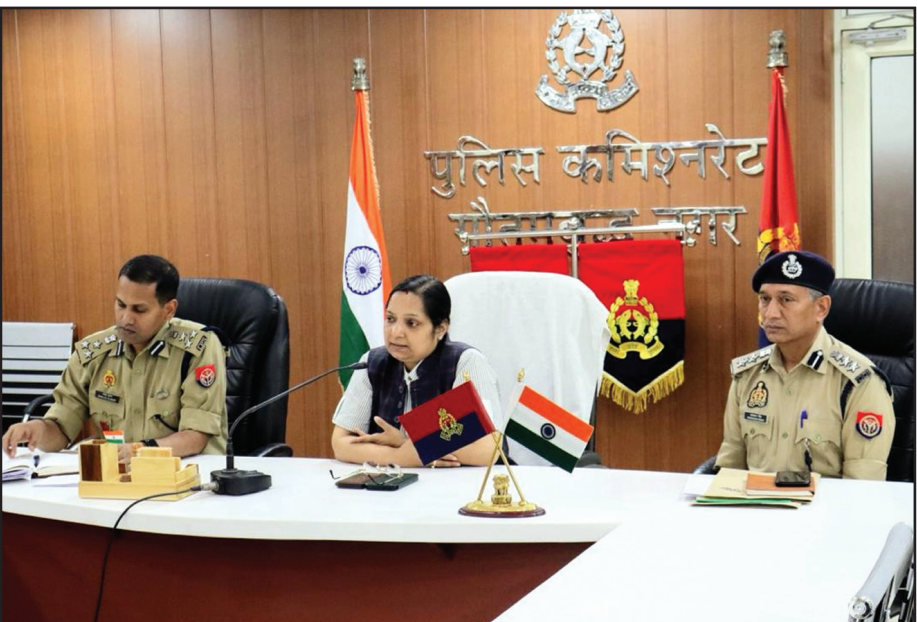
गौतमबुद्धनगर की पुलिस कमिश्नर लक्ष्मी सिंह ने ज्वाइंट सीपी नोएडा हेड क्वार्टर व DCP नोडल अधिकारी चुनाव के साथ आगामी लोकसभा सामान्य निर्वाचन-2024 को शान्तिपूर्ण तरीके से सम्पन्न कराने के लिए बाहर से आने वाले पुलिस बल के ठहरने की व्यवस्था के उचित प्रबंधन कराने के निर्देश अधिकारियों को दिए।