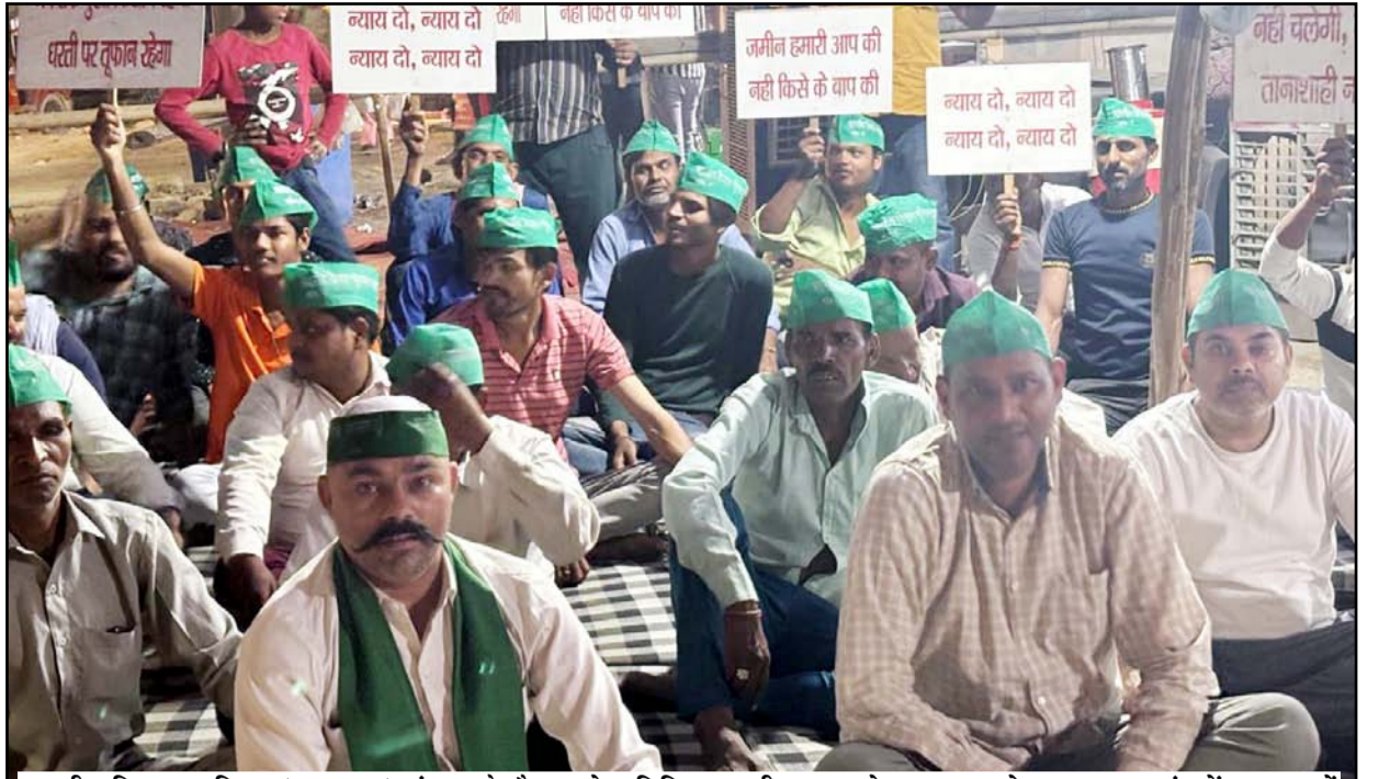
भारतीय किसान यूनियन (बलराज) संगठन के बैनर तले अनिश्चित कालीन धरना सेक्टर-142 नोएडा शहरवा गांव में आज 60वें दिन भी धरना जारी रहा।