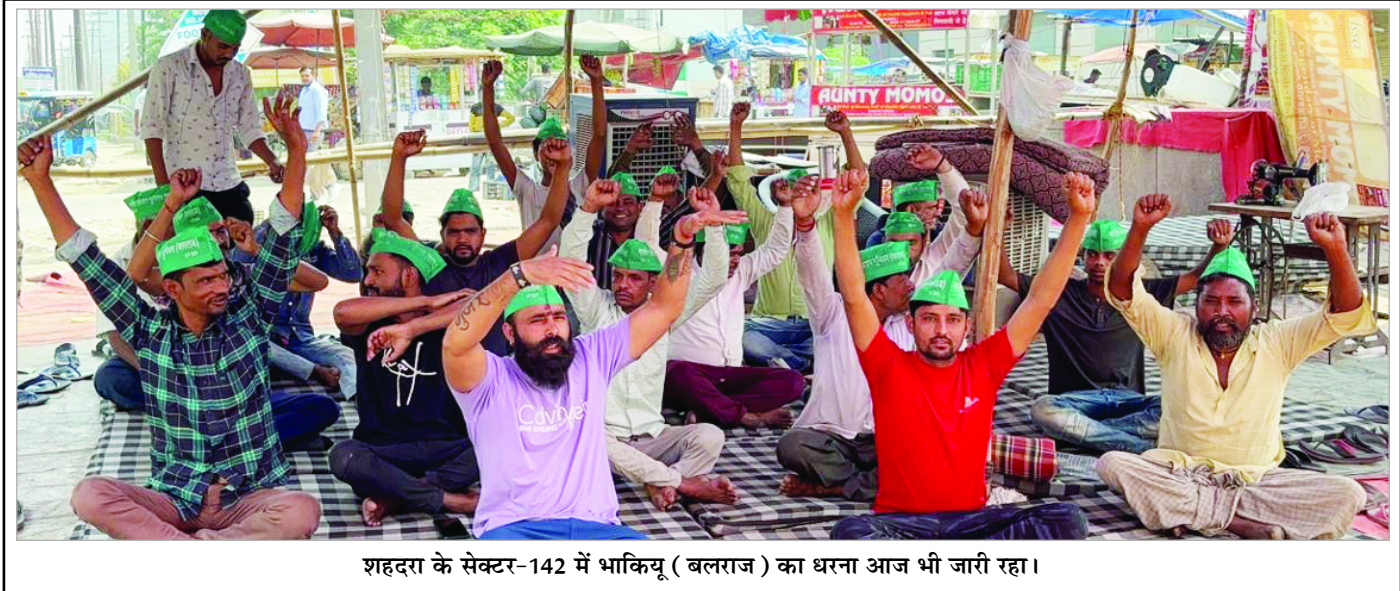
शहरा के सेक्टर-142 में भाकियू (बलराज) का धरना आज भी जारी रहा।