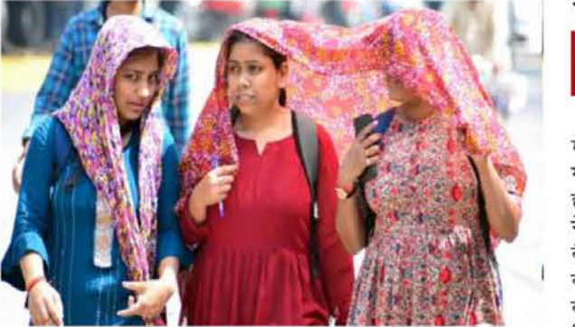
देखने को मिली है। ये तापमान सामान्य सीमा से 2-4 डिग्री सेल्सियस अधिक था। शनिवार को, उत्तर प्रदेश के कुछ स्थानों पर और बिहार, गुजरात क्षेत्र, मध्य महाराष्ट्र, पश्चिम बंगाल और सिक्किम, नागालैंड, मणिपुर, मिजोरम और त्रिपुरा में अलग-अलग स्थानों पर न्यूनतम तापमान सामान्य से 3-5 डिग्री सेल्सियस अधिक था। आंध्र प्रदेश के नंदाय में शुक्रवार को

कर्नाटक और तेलंगाना के अलग-अलग इलाकों में और शनिवार को ओडिशा, झारखंड, गंगीय पश्चिम बंगाल, तटीय आंध्र प्रदेश और यनम और रायलसीमा में हीटवेव की स्थिति की भविष्यवाणी की है। शनिवार और रविवार को उत्तरी