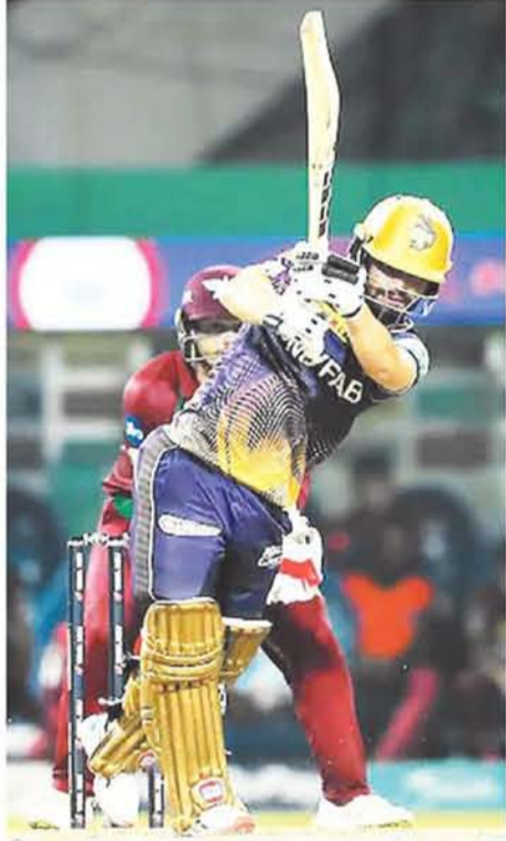
विशाखापत्तनम, एर्जेसी। आईपीएल 2024 अभी तक बल्लेबाजों के नाम रहा है। फैंस को इस बार

आईपीएल के इतिहास में अभी तक 4 टीमों ही 250+ का स्कोर बना पाई है। ये कारनामा सबसे पहले यल चैलेंजर्स बेंगलुरु की टीम ने किया था। रॉयल चैलेंजर्स बेंगलुरु ने 2013 में पुणे वॉरियर्स के खिलाफ बेंगलुरु ने 299 रन बनाए थे। इस मुकामले में रॉयल चैलेंजर्स बेंगलुरु के लिए बाएं हाथ के सलामी बल्लेबाज क्रिस गेल ने 66 गेंदों में 175 रन की पारी खेली थी जिसमें 13 चौके और 17 छक्के शामिल थे।