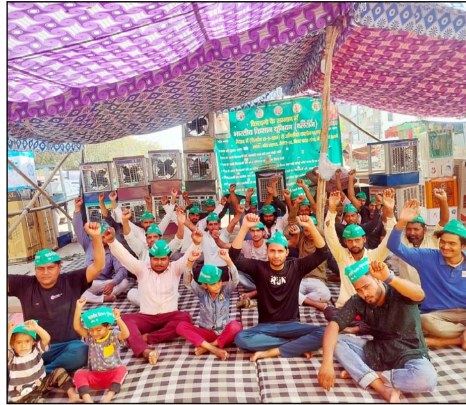
भारतीय किसान यूनियन (बलराज) संगठन के बैनर तले अनिश्चितकालीन धरना सेक्टर-142 नोएडा शहदरा गांव में आज 50वें दिन भी धरना जारी है।