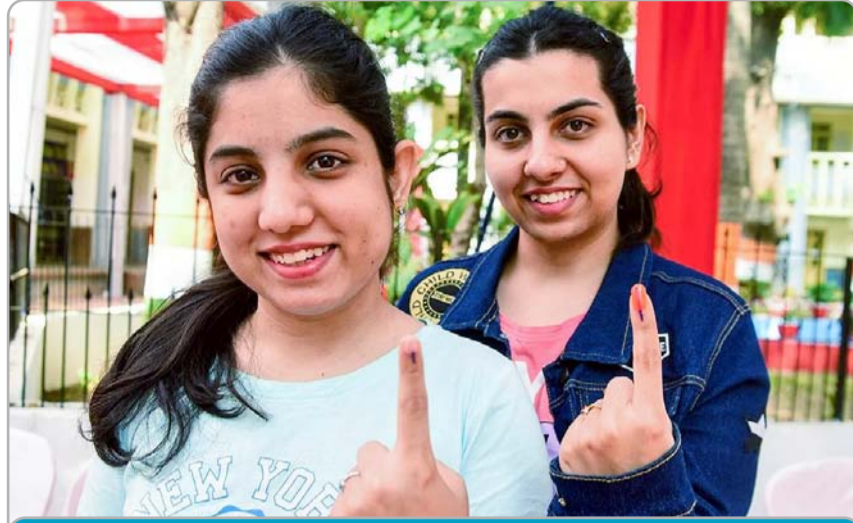
एक बात और चुनाव घोषणा पत्रों में मुफ्त की सुविधाओं की भरमार भी अब लोगों को अधिक लुभाने वाली नहीं लगती। कारण साफ है इससे एक ओर प्रत्यक्ष अप्रत्यक्ष कर देने वाला अपने को ठगा समझने लगा है, वहीं लाभार्थी इसे राजनीतिक दलों की कमजोरी समझने लगा है।

दे रहा है। इस मामले में लोग लालू की बढ़ाई करने लगे हैं कि लालू ने गिरफ्तार होते ही अपना पद त्याग दिया और भले ही राबड़ी देवी को मुख्यमंत्री बनाया पर पद की गरिमा को तो बनाये रखा। केजरीवाल द्वारा बार बार सम्मन की