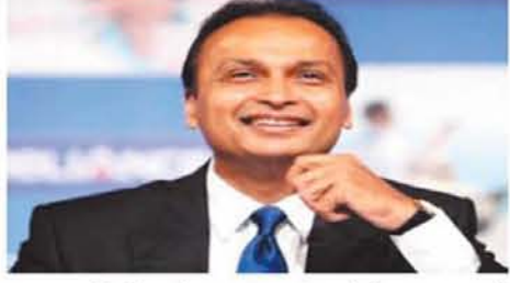
28.25 प्रति शेयर के स्तर पर पहुंच गई है। इस समय में लगभग 2,250 प्रतिशत की वृद्धि दर्ज की गई है।

नई दिल्ली, एप्रैल 1। वित्त वर्ष 2024 के आखिरी सप्ताह में रिलायंस पावर के शेयरों में जबरदस्त तेजी देखी गई। 10 जनवरी 2024 से 13 मार्च 2024 तक वेस विलिंडिंग मोड में रहने के बाद रिलायंस एडिजी (अनिल धीरूभाई अंबानी ग्रुप) की यह कंपनी इन दिनों रिलायंस कमर्शियल फाइनेंस द्वारा कर्ज में कटौती और पूंजी निवेश को लेकर खबरों में है। इससे रिलायंस पावर के शेयरों में जोरदार खरीदारी हुई। 13 मार्च 2024 को 20.40 प्रति शेयर के स्तर पर समाप्त होने के बाद अनिल अंबानी की कंपनी के शेयर की कीमत एनएसई पर 28.25 प्रति शेयर के स्तर तक पहुंच गई है। यानी आखिरी सप्ताह में लगभग 40 प्रतिशत की तेजी आई है। हालांकि, रिलायंस.इल कंपनी के स्टॉक ने पोस्ट-कोविड रिवॉल्यूशन में मजबूत बढ़त दिखाई है। पिछले चार सालों में एनएसई पर रिलायंस पावर के शेयर की कीमत 1.20 प्रति शेयर से बढ़कर