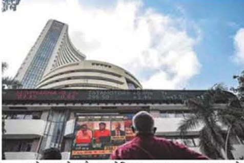
करोड़ रुपये और इन्फोसिस का 4,163.13 करोड़ रुपये कम होकर 6,22,117.38 करोड़ रुपये रहा। भारतीय एयरटेल का मूल्यंकन 3,817.18 करोड़ रुपये घटकर 6,95,038.48 करोड़ रुपये रहा।

नई दिल्ली, एप्रैल 1। पिछले हफ्ते शेयर बाजार में केवल तीन ही दिन कारोबार हुआ। इस दौरान बीएसई सेंसेक्स में 819.41 अंक यानी 1.12 फीसदी की तेजी रही। इससे 10 सबसे मूल्यवान कंपनियों में से सात का बाजार पूंजीकरण संयुक्त रूप से पिछले सप्ताह 67,259.99 करोड़ रुपये बढ़ा। इसमें सबसे ज्यादा फायदे में मुकेश अंबानी की रिलायंस इंडस्ट्रीज रही। कंपनी का मार्केट कैप पिछले हफ्ते 45,262.59 करोड़ रुपये बढ़कर 20,14,010.63 करोड़ रुपये पर पहुंच गया। इसी तरह भारतीय स्टेट बैंक का बाजार पूंजीकरण 5,533.26 करोड़ रुपये बढ़कर 6,71,666.29 करोड़ रुपये हो गया। भारतीय जीवन बीमा निगम का बाजार पूंजीकरण 5,218.12 करोड़ रुपये बढ़कर 5,78,484.29 करोड़ रुपये और आईसीआईसीआई बैंक का मूल्यंकन 4,132.67 करोड़ रुपये बढ़कर 7,69,542.65 करोड़ रुपये हो गया। एचडीएफसी बैंक का बाजार पूंजीकरण 4,029.69 करोड़ रुपये बढ़कर 11,00,184.60 करोड़ रुपये और हिंदुस्तान यूनिटीवर्क का 2,819.51 करोड़ रुपये बढ़कर 5,32,946.04 करोड़ रुपये हो गया। आईटीसी का एमएफए 264.15 करोड़ रुपये बढ़कर 5,35,032.74 करोड़ रुपये हो गया। हालांकि, देश की सबसे बड़ी आईटी कंपनी टाटा कंसल्टेंसी सर्विसेज का बाजार पूंजीकरण 10,691.45 करोड़ रुपये घटकर 14,05,102.38