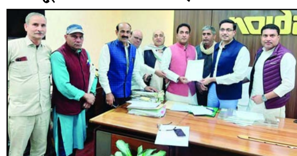
किसान संघर्ष समिति ने सीईओ को सौंपा 6 सूत्रीय ज्ञापन