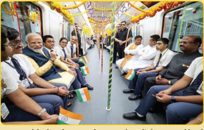
बना हावड़ा मेट्रो स्टेशन देश का सबसे गहराई में स्थित स्टेशन भी होगा। उद्घाटन कार्यक्रम के बाद प्रधानमंत्री मोदी ने स्कूल के छात्रों के साथ एस्प्लेनेड से हावड़ा मैदान तक मेट्रो की यात्रा की और मेट्रो के कर्मचारियों (शेष पृष्ठ-5 पर)

कोलकाता (एजेंसी)। प्रधानमंत्री नरेंद्र मोदी ने आज कोलकाता में कवि सुभाष मेट्रो, माइरोहाट मेट्रो, कोल्चि मेट्रो, आगरा मेट्रो, मेरठ-आरआरटीएस सेक्शन, पुणे मेट्रो, एस्प्लेनेड मेट्रो-कोलकाता से मेट्रो रेलवे सेवाओं को हरी झंडी दिखाई। प्रधानमंत्री नरेंद्र मोदी ने बुधवार को देश में कई मेट्रो परियोजनाओं का लोकार्पण किया। इसमें कोलकाता में पानी के अंदर देश की पहली मेट्रो लाइन भी शामिल है। इस दौरान कोलकाता मेट्रो के ईस्ट वेस्ट कॉरिडोर में 4,965 करोड़ रुपये की लागत से निर्मित हावड़ा मैदान-एस्प्लेनेड खंड का उद्घाटन भी किया गया। यह किसी भी बड़ी नदी के नीचे देश की पहली परिवहन सुरंग है। इस खंड में