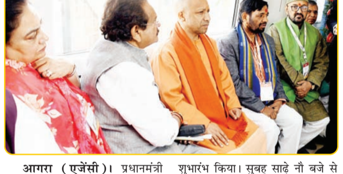
आगरा (एजेंसी)। प्रधानमंत्री नरेंद्र मोदी ने कोलकाता से वर्चुअल माध्यम से आगरा मेट्रो के प्राथमिकता वाले छह किमी लंबे कॉरिडोर का शुभारंभ किया। सुबह साढ़े नौ बजे से ताजमहल मेट्रो स्टेशन पर आयोजित कार्यक्रम में उत्तर प्रदेश के मुख्यमंत्री योगी आदित्यनाथ, (शेष पृष्ठ-5 पर)