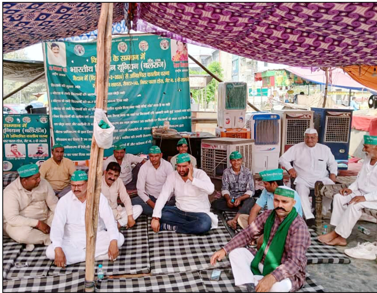
सेक्टर-142 शहदरा में भाकियू ( बलराज ) का धरना आज भी जारी रहा।