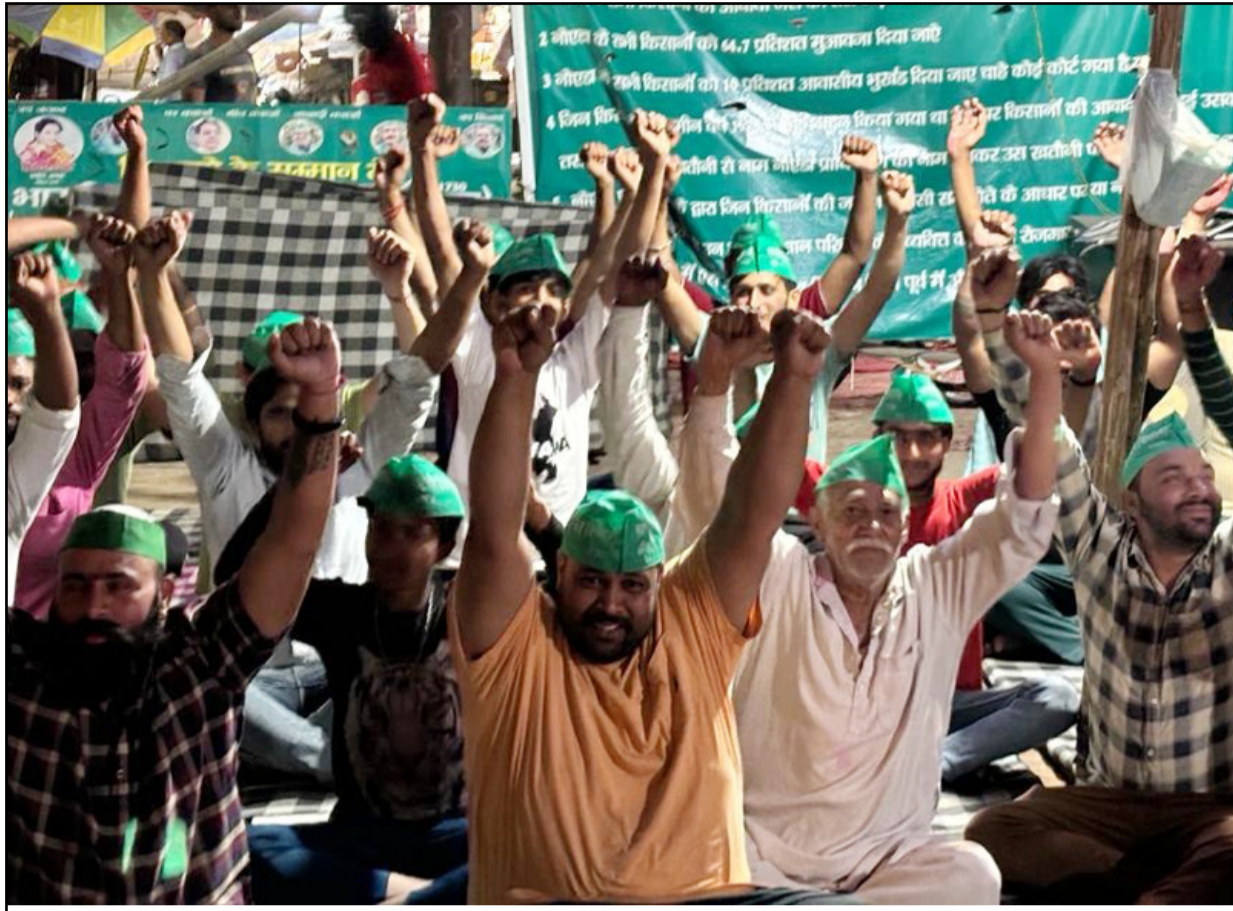
भारतीय किसान यूनियन बलराज संगठन के बैनर तले अनिश्चितकालीन धरना सेक्टर-142 नोएडा शहदरा गांव में आज 40वें दिन भी जारी रहा।