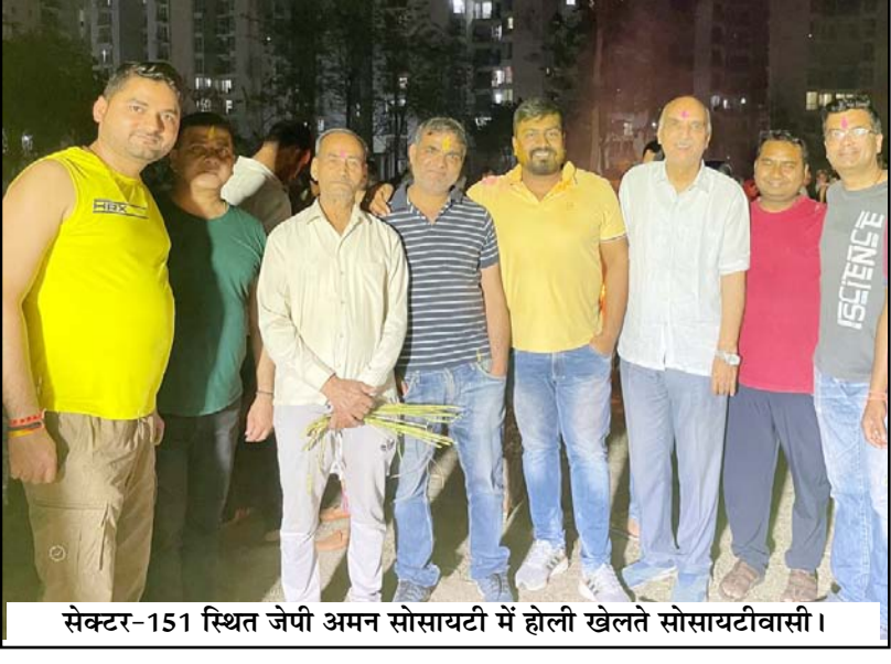
सेक्टर-151 स्थित जेपी अमन सोसायटी में होली खेलते सोसायटीवासी।