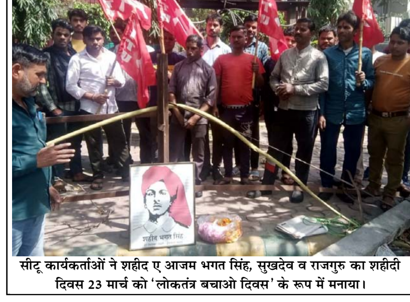
सीटू कार्यकर्ताओं ने शहीद ए आजम भगत सिंह, सुखदेव व राजगुरु का शहीदी दिवस 23 मार्च को 'लोकतंत्र बचाओ दिवस' के रूप में मनाया।