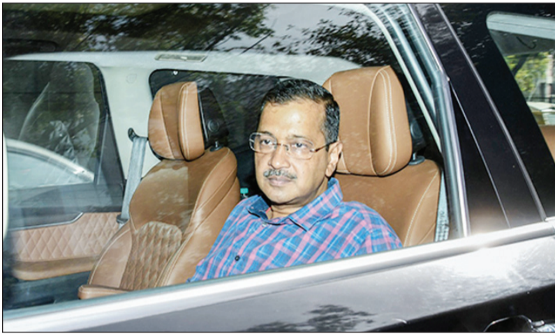
लिया। इस याचिका पर आज ही जस्टिस संजीव खन्ना की बेंच सुनवाई करने वाली थी।

नई दिल्ली (एजेंसी)। दिल्ली के मुख्यमंत्री अरविंद केजरीवाल की ईडी द्वारा गिरफ्तारी के बाद बवाल मच गया है। सभी विपक्षी दलों ने केजरीवाल की गिरफ्तारी का विरोध किया है। वहीं दिल्ली में 'आप' के कार्यकर्ताओं द्वारा प्रदर्शन किया जा रहा है। आईटीओ पर प्रदर्शन कर रहे आप कार्यकर्ताओं और दिल्ली सरकार में मंत्री आतिथी व सौरभ भारद्वाज को दिल्ली पुलिस ने हिरासत में ले लिया है। इस दौरान आईटीओ पर यातायात जाम हो गया जिसे बाद में पुलिस ने खुलवाया। आम आदमी पार्टी के प्रदर्शन को देखते हुए आईटीओ का मेट्रो स्टेशन शाम 6.30 बजे तक के लिए बंद कर दिया गया। उधर शराब घोटाले के मामले में अरविंद केजरीवाल की गिरफ्तारी पर रोक की मांग को लेकर लीगल टीम सुप्रीम कोर्ट पहुंची, लेकिन दोपहर 12 बजे के बाद सुप्रीम कोर्ट में दाखिल याचिका को वापस ले