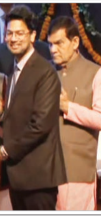
संदेह के दायरे में रखा गया था। आज मशीनरी वही है, लोग वही हैं, बस काम का तरीका बदला है। उन्होंने युवा अफसरों से कहा