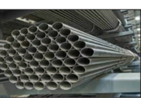
बेच रहा है। सूचना के आधार पर उन्होंने थाना बिसरख कोतवाली पुलिस को इसकी सूचना दी। बिसरख कोतवाली पुलिस की टीम तथा लॉगल कंपनी की टीम चिपयाना बुजुर्ग स्थित मिश्रा ट्रेडर्स की दुकान पर पहुंची। दुकान के गोदाम की तलाशी लेने पर यहां से आशीर्वाद कंपनी के 10 बंडल पाइप बरामद हुए। (शेष पृष्ठ-4 पर)

नोएडा (चेतना मंच)। पाइप बनाने वाली आशीर्वाद कंपनी के नकली पाईप बेचने की शिकायत पर थाना बिसरख पुलिस ने एक दुकान पर छापे मारा। दुकान से आशीर्वाद कंपनी के 10 बंडल नकली पाइप बरामद हुए हैं। कंपनी प्रतिनिधि की शिकायत पर दुकानदार के खिलाफ कॉपीराइट एक्ट के तहत मुकदमा दर्ज किया गया है।