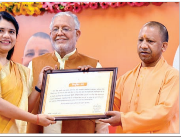
कि आपके पास जनता की दुआ लेने और बड़ुआ लेने का मौका होता है। ये आपको तय करना है कि 35 साल क्या लेना है। बड़ुआ लेने