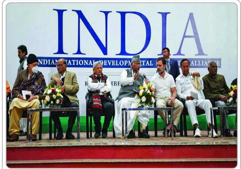
वर्ष 2024 के लोकसभा चुनाव ऐतिहासिक होंगे। ऐसी संभावनाएं हैं कि भाजपा शारदार एवं ऐतिहासिक जीत को सुनिश्चित करने के लक्ष्य को लेकर सक्रिय है। नरेन्द्र मोदी चाहते हैं कि इन चुनावों के परिणाम उनके 400 सीटों के लक्ष्य को हासिल करें।

दलों का राज्य की राजनीति पर दबदबा बना रहा। पटनायक राजनीति के महारथी हैं, उनको