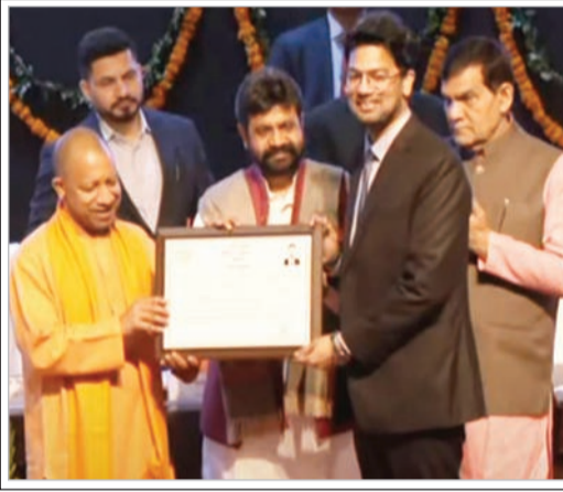
उन्होंने कहा कि सरकार ईमानदारी से काम करती है तो परसेप्शन बदलता है। पहले भी लोग वही थे लेकिन मशीनरी को

लखनऊ (एजेसी)। उत्तर प्रदेश के मुख्यमंत्री योगी आदित्यनाथ ने कहा है कि परीक्षा की शुचिता में जिन लोगों ने संघ लगाई है उन्हें बख्शा नहीं जाएगा। उनके खिलाफ कार्रवाई हो रही है। वो कहीं भी हों हम उन्हें ढूँढ निकालेंगे। उन्होंने कहा कि युवाओं के भविष्य से खिलवाड़ करने वालों का भविष्य बर्बाद कर देंगे। ऐसे लोगों पर छापे मारे जा रहे हैं। प्रॉपर्टी सील हो रही है। मुख्यमंत्री योगी ने बुधवार को लोक सेवा आयोग के अंतर्गत चयनित 39 एसडीएम, 41 पुलिस अधीक्षकों और 16 कोषाधिकारियों व लेखाधिकारियों को नियुक्ति पत्र वितरित करने के बाद संबोधित कर रहे थे।