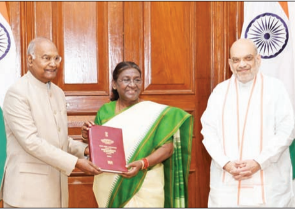
भवन में द्रौपदी मुर्मू से मुलाकात एक चुनाव' पर अपनी रिपोर्ट की। इस दौरान समिति ने 'एक राष्ट्र, राष्ट्रपति द्रौपदी मुर्मू (शेष पृष्ठ-4 पर)

नई दिल्ली (एजेसी)। लोकसभा और राज्यों की विधानसभा के सहित विभिन्न निकायों के एक साथ चुनाव कराने के मुद्दे पर पूर्व राष्ट्रपति रामनाथ कोविंद की अध्यक्षता वाली उच्च स्तरीय समिति ने आज 'एक राष्ट्र, एक चुनाव' पर अपनी रिपोर्ट सौंपी। यह रिपोर्ट राष्ट्रपति द्रौपदी मुर्मू को सौंपी गई है। रिपोर्ट सौंपे जाने के बाद यह संभावना जताई जा रही है कि 2029 में 'एक राष्ट्र एक चुनाव' के नियम को लागू किया जा सकता है।