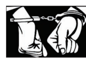
थाना बिसरख पुलिस ने चार ट्रक चालकों को गिरफ्तार किया है। पकड़े गए ट्रक चालक ट्रक में लदे सरिया को रास्ते में उतारकर बेच देते थे। ट्रक चालक सरिया चोरी को बड़े ही सुनिश्चित तरीके से अंजाम देते थे। चोरी करने से पूर्व यह अपने ट्रक या ट्राला का डीजल टैंक खाली रखते थे। ट्रक से सरिया उतारने के बाद चालक उतने ही वजन का डीजल गाड़ी में डलवा

ग्रेटर नोएडा (चेतना मंच)। अगर आप कंपनी से सरिया मंगवा रहे हैं तो सावधान हो जाइए ऐसा ना हो कि ट्रक चालक आपको हजारों रुपए का चूना लगा दें।