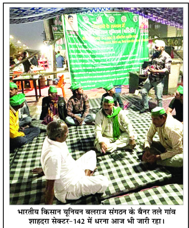
भारतीय किसान यूनियन बलराज संगठन के बैनर तले गांव शाहदरा सैक्टर-142 में धरना आज भी जारी रहा।