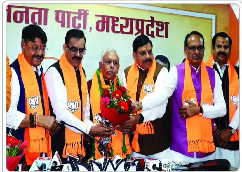
लोकसभा चुनाव की तैयारियों में जुटी कांग्रेस को रोज एक न एक झटका लग रहा है। उसके नेता कब उसका साथ छोड़ दें पता नहीं चलता। जैसे ही कोई चुनाव शुरू होता है, उसी समय से नेताओं का कांग्रेस छोड़कर जाना शुरू हो जाता है।

दामन छोड़ चुके हैं। वे वे नेता हैं जिन्हें कांग्रेस ने पहचान दी, केंद्रीय मंत्री, राज्य में मंत्री बनाया,