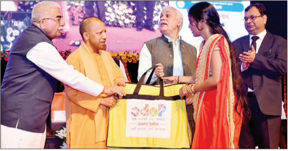
प्रदेश के सूक्ष्म, लघु और मध्यम उद्यम (एमएसएमई) के विस्तार के लिए 30,826 करोड़ के मेगा ऋण वितरण कार्यक्रम में कही। मुख्यमंत्री ने इस अवसर पर औद्योगिक आस्थानों में भूखंडों के

लखनऊ (एजेंसी)। उत्तर प्रदेश के मुख्यमंत्री योगी आदित्यनाथ ने उत्तर प्रदेश को देश के सबसे बड़े मैन्यूफैक्चरिंग हब के रूप में विकसित करने का आह्वान उत्तर प्रदेश के सूक्ष्म लघु और मध्यम उद्यम (एमएसएमई) से जुड़े उद्यमियों से किया है। मुख्यमंत्री ने घोषणा की कि इस वर्ष-2024 में भी एक बार फिर ग्रेटर नोएडा में इंटरनेशनल ट्रेड शो का आयोजन सितंबर महीने में किया जाएगा। मुख्यमंत्री ने प्रदेश भर के मैन्यूफैक्चरिंग उद्योग से जुड़े लोगों को तैयार रहने तथा अपने-अपने उत्पादों को इंटरनेशनल ट्रेड शो में प्रदर्शित करने के लिए कहा। मुख्यमंत्री ने यह बात उत्तर