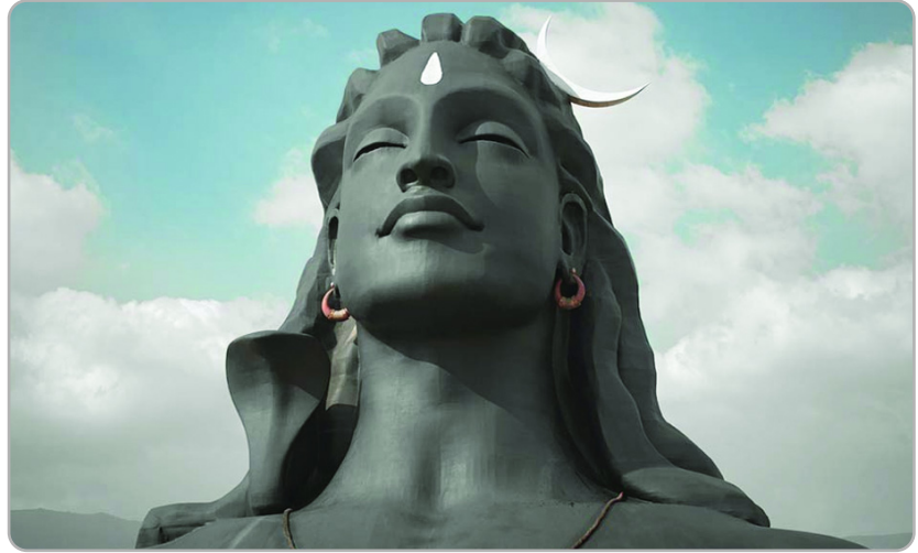
शिव की देह पर लगी भस्म का अंगराग उनकी निष्कामता, निर्लोभता और निर्लिप्तता का प्रतीक है। सर्वप्रिय बनने के लिए उत्सुक नेतृत्व को व्यक्तिगत सुख सुविधाओं और वैभवपूर्ण प्रदर्शनों की विलासप्रियता पर अंकुश लगाना चाहिए।

शिव की देह पर लगी भस्म का अंगराग उनकी निष्कामता, निर्लोभता और निर्लिप्तता का प्रतीक है। सर्वप्रिय बनने के लिए उत्सुक नेतृत्व को व्यक्तिगत सुख सुविधाओं और वैभवपूर्ण प्रदर्शनों की विलासप्रियता पर अंकुश लगाना चाहिए। शिव की देह पर लगी भस्म का अंगराग उनकी निष्कामता, निर्लोभता और निर्लिप्तता का प्रतीक है। सर्वप्रिय बनने के लिए उत्सुक नेतृत्व को व्यक्तिगत सुख सुविधाओं और वैभवपूर्ण प्रदर्शनों की विलासप्रियता पर अंकुश लगाना चाहिए। निजी महत्वाकांक्षाएँ नेता को इन्द्र बना सकती हैं, शिव नहीं