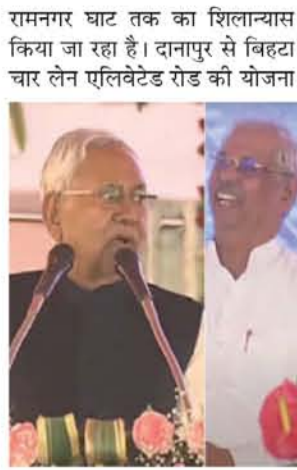
रामनगर घाट तक का शिलान्यास किया जा रहा है। दानापुर से बिहटा चार लेन एलिवेटेड रोड की योजना

पाए। 20 महीने बाद बिहार दौरे पर आए प्रधानमंत्री नरेंद्र मोदी ने शनिवार को औरंगाबाद में जनसभा को संबोधित किया। उनके भाषण से पहले मुख्यमंत्री नीतीश कुमार ने मंच से संबोधन दिया। इस दौरान उन्होंने बिहार में केंद्र सरकार द्वारा चलाई गई योजनाओं के लिए आभार जताया। नीतीश ने कहा कि उन्हें खुशी है पीएम मोदी बिहार आए हैं। अब आते-जाते रहेंगे। लाखों की संख्या में लोग पीएम मोदी की रेली में आए हैं। बहुत खुशी हो रही है। रेलवे, पथ निर्माण और नमामि गंगे की महत्वपूर्ण योजनाओं का शिलान्यास और उद्घाटन होने जा रहा है। नीतीश ने कहा कि आमस से दरभंगा फोरलेन बनाया जा रहा है, जिसमें आमस से