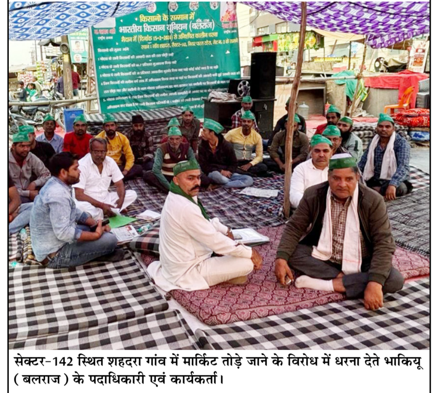
सेक्टर-142 स्थित शहदरा गांव में मार्किट तोड़े जाने के विरोध में धरना देते भाकियू (बलराज) के पदाधिकारी एवं कार्यकर्ता।