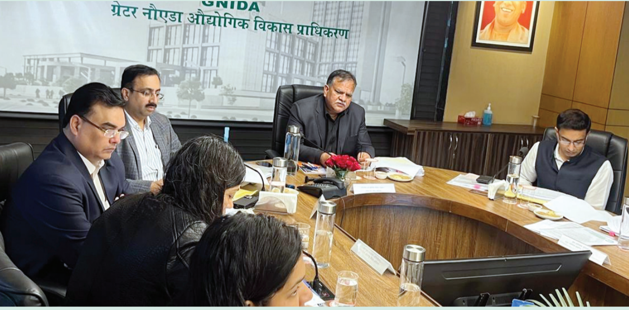
ग्रेटर नोएडा औद्योगिक विकास प्राधिकरण

किया गया। वहीं 2024-25 में आवंटनों की किश्तों से और नई प्रस्तावित योजनाओं एवं डिफाल्ट धनराशि की