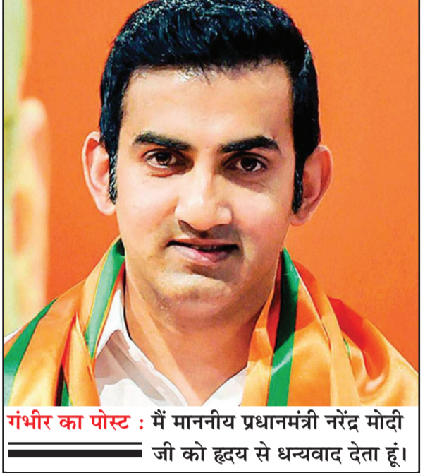
गंभीर का पोस्ट : मैं माननीय प्रधानमंत्री नरेंद्र मोदी जी को हृदय से धन्यवाद देता हूँ।

नई दिल्ली (एजेंसी)। पूर्वी दिल्ली के सांसद गौतम गंभीर राजनीति की पिच पर अब बैटिंग नहीं करेंगे। उन्होंने इसे लेकर एक पोस्ट किया। गंभीर ने प्रधानमंत्री नरेंद्र मोदी को अपने पोस्ट में थैंक्स कहा। दरअसल, गंभीर अब क्रिकेट पर ही फोकस करना चाहते हैं। गौतम गंभीर 2019 में लोकसभा चुनाव जीतकर संसद पहुंचे थे। वर्तमान में वो आईपीएल टीम कोलकाता नाइट राइडर्स टीम के मेंबर हैं। गंभीर ने सोशल मीडिया पर आज एक पोस्ट शेयर किया, इसमें उन्होंने लिखा- मैंने माननीय पार्टी अध्यक्ष जेपी नड्डा से अनुरोध किया है कि वो मुझे मेरे राजनीतिक कर्तव्यों से मुक्त करें ताकि मैं अपनी आगामी क्रिकेट प्रतिबद्धताओं पर ध्यान केंद्रित कर सकूँ। मैं माननीय प्रधानमंत्री नरेंद्र मोदी जी को हृदय से धन्यवाद देता हूँ। इसके साथ ही उन्होंने केंद्रीय गृहमंत्री अमित शाह को टैग करते हुए लिखा- मुझे लोगों की सेवा करने का अवसर देने के लिए, जय हिन्द। गौतम गंभीर फिलहाल पूर्वी दिल्ली से बीजेपी के टिकट पर गंभीर ने कांग्रेस उम्मीदवार बंपर जीत हासिल की थी। तब गंभीर ने कांग्रेस उम्मीदवार