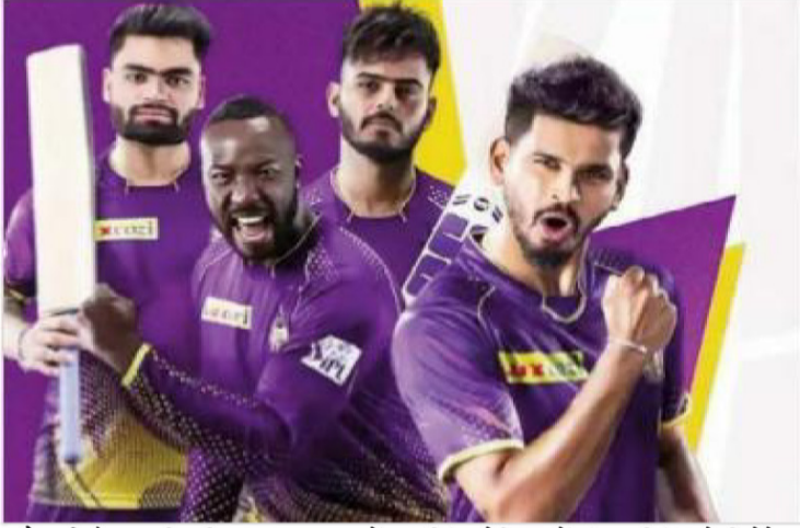
मोहाली के नव-विकसित महाराजा यादवेंद्र सिंह स्टेडियम में पंजाब किंग्स से भिड़ेंगे।