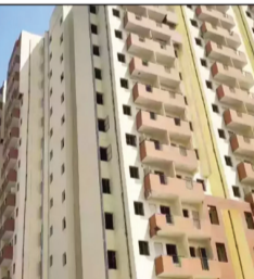
आदेश की भी अवहेलना करते हुए लगातार निर्माण कार्य कर रहे हैं। ग्रेटर नोएडा प्राधिकरण के

ग्रेटर नोएडा (चेतना मंच)। ग्रेटर नोएडा प्राधिकरण की अर्जित व कब्जा प्राप्त भूमि पर अवैध रूप से प्लाटिंग तथा बहुमंजिला पलैटों का निर्माण करने के आरोप में सात लोगों के खिलाफ थाना बिसरख में मुकदमा दर्ज कराया गया है। प्राधिकरण अधिकारियों का कहना है कि जिस भूमि पर निर्माण कार्य किया जा रहा है उस पर इलाहाबाद उच्च न्यायालय ने स्थान आदेश दिया हुआ है। आरोपी न्यायालय के