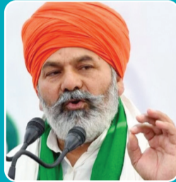
तार से हाईवे पर यातायात को बाधित नहीं किया जा रहा है।