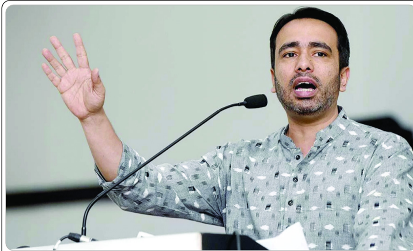
विपक्षी गठबंधन की हालत से देश के सामने एक बात और स्पष्ट हो गयी है कि बेमेल विचारधारा वाला यह गठबंधन सिर्फ सत्ता स्वार्थ के लिए बना था। जहाँ तक राष्ट्रीय लोक दल की बात है तो उसके बारे में बताया जा रहा है कि उसका भाजपा के साथ आना तय हो चुका है।

प्रस्ताव को स्वीकार करने का मन बना चुके हैं क्योंकि उन्हें अपनी पार्टी के क्षेत्रीय दल के दर्जे को बचाना है। यदि उन्होंने चुनाव आयोग द्वारा निर्धारित मानदंडों के अनुसार इन लोकसभा