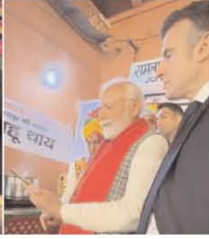
(हवा महल) के पास एक साथ साझा की थी। यह यूपीआई के साथ भुगतान की गई चाय थी। यह इस बात का एक आदर्श संरक्षण है कि यह इतना खास क्यों है। यह

दोस्ती और इस तरह के उत्सव, परंपरा की गर्मजोशी है। यही वह है जो हम मिलकर करना चाहते हैं। बीजेपी द्वारा ट्वीट किए गए एक वीडियो में, पीएम मोदी और मैक्रों को हवा महल के पास एक दुकान के बाहर कुल्हड़ (मिट्टी के कप) में परोसी गई चाय की चुस्की लेते हुए बातचीत करते देखा गया। चाय के बाद पीएम मोदी यूपीआई के जरिए चाय का पेमेंट करते नजर आए। उन्होंने मैक्रों को यूपीआई भुगतान करते समय दिखाया और जब दुकानदार को तुरंत भुगतान की पुष्टि मिली, तो फ्रांसीसी राष्ट्रपति सुखद