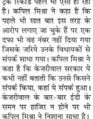
केजरीवाल की सरकार में

नई दिल्ली (एजेंसी)। शाहदर में एक बड़ी दुर्घटना हुई है जहां एक मकान में भीषण आग हुई। आग गली नंबर 26 के एक मकान के ग्राउंड फ्लोर पर लगी। दमकल विभाग के मुताबिक 6.55 पर आग पर काबू पाया जा चुका है। वहीं, घर के अंदर फसे कुछ लोगों को बाहर भी निकाल लिया गया। जानकारी के अनुसार ग्राउंड फ्लोर पर बाइपर के रबड़ कर्टिंग की फैक्ट्री चलती है और ऊपर के फ्लोर पर लोग रहते हैं। पहले ग्राउंड फ्लोर पर आग लगी जो देखते ही देखते पहले फ्लोर तक पहुंच गई। इस हादसे में 6 लोगों में से 4 लोगों की मौत हो चुकी है जिसमें दो महिलाएं, एक 17 साल का लड़का और 1 साल का छोटा बच्चा शामिल है। वहीं, दो लोगों गंभीर रूप से झुलस कर जीवित बचे हैं जिनकी हालत गंभीर बताई जा रही है। मौके पर पहुंची दमकल की टीम ने आग पर काबू पा लिया है, हालांकि, आग कैसे लगी इसका स्पष्ट कारण अभी सामने नहीं आ पाया है। डीसीपी शाहदर जिला के मुताबिक पुलिस और दमकल विभाग ने घर से कुछ लोगों को बेहोशी की हालत में हॉस्पिटल भेजा।