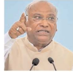
स्पष्ट रूप से नहीं जानता कि उनके मन में क्या है।" इस बात के पुष्टा संकेत हैं कि जद (यू) प्रमुख और बिहार के मुख्यमंत्री नीतीश कुमार राज्य में सत्तारूढ़

इन्सल्टिव अलायंस' (इंडिया) को एकजुट रखने के लिए हरसंभव प्रयास करेंगे। उन्होंने कहा कि उन्हें इस बारे में कोई स्पष्टता नहीं है कि जद (यू) नेतृत्व के मन में क्या है। जद(यू) के 'इंडिया' गठबंधन से बाहर जाने की संभावना पर एक सवाल के जवाब में खरगे ने कहा, "क्या वे बाहर जा रहे हैं? मुझे अभी तक इस बारे में कोई जानकारी नहीं मिली है। मैंने उनके नेतृत्व को एक पत्र लिखा है और उनसे बात करने की कोशिश की है। मैं