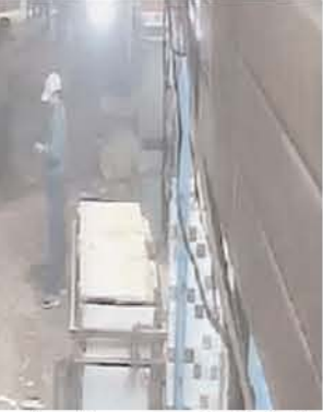
बात ये है कि वो दुकानदार उस लड़के को बचाने की बजाए अपने दुकान का सामान समेटने लगता है। आरोपियों के जाने के बाद भी वो न तो लड़के को उठाने की कोशिश करता है, न ही पुलिस को कॉल करता है। काफी समय बाद लोग वहां पहुंचते हैं। इसके बाद पुलिस को सूचित किया जाता है। मौके पर पहुंची पुलिस ने गंभीर रूप से घायल शख्स को अस्पताल में भर्ती करा दिया है। वहां वो जिंदगी और मौत के बीच जंग लड़ रहा है। पुलिस ने घायल के परिजनों की तहरीर पर केस दर्ज कर लिया है। आरोपियों की तलाश की जा रही है। सीसीटीवी फुटेज के जरिए उनकी पहचान की जा रही है। बताया जा रहा है कि शराब पीने के दौरान उनके बीच किसी बात को लेकर विवाद हो गया था। इसके बाद आरोपियों ने इस वारदात को अंजाम दिया है।