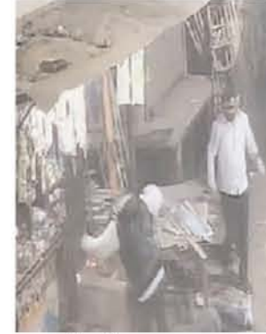
बात ये है कि वो दुकानदार उस लड़के को बचाने की बजाए अपने दुकान का सामान समेटने लगता है। आरोपियों के जाने के बाद भी वो न तो लड़के को उठाने की कोशिश करता है, न ही पुलिस को कॉल करता है। काफी समय बाद लोग वहां पहुंचते हैं। इसके बाद पुलिस को सूचित किया जाता है। मौके पर पहुंची पुलिस ने गंभीर रूप से घायल शख्स को अस्पताल में भर्ती करा दिया है। वहां वो जिंदगी और मौत के बीच जंग लड़ रहा है। पुलिस ने घायल के परिजनों की तहरीर पर केस दर्ज कर लिया है। आरोपियों की तलाश की जा रही है। सीसीटीवी फुटेज के जरिए उनकी पहचान की जा रही है। बताया जा रहा है कि शराब पीने के दौरान उनके बीच किसी बात को लेकर विवाद हो गया था। इसके बाद आरोपियों ने इस वारदात को अंजाम दिया है।