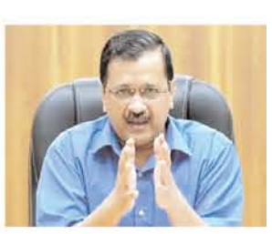
शिक्षा मंत्री आतिशी ने भी केजरीवाल के आरोपों के साथ सहमत जताई है और कहा है कि ऑपरेशन कमल के तहत आम आदमी पार्टी की सरकार गिराने की कोशिश बीजेपी ने की और आप के सात विधायकों को 25-25 करोड़ का ऑफर दिया गया। आम आदम पार्टी ने कहा है कि भाजपा ने इसी एसओपी से गोवा, अरुणाचल प्रदेश, कर्नाटक और मध्य प्रदेश में सरकार गिराया। आप ने यहाँ तक कहा है कि जहाँ इनकी सरकार नहीं बनती है, वहाँ लालतार यह सरकार गिराने की कोशिश करते हैं।

नई दिल्ली (एजेंसी)। बिहार में जारी सियासी घमासान के बीच दिल्ली की आम आदमी पार्टी ने भारतीय जनता पार्टी पर गंभीर आरोप लगा दिया है। दिल्ली के मुख्यमंत्री अरविंद केजरीवाल ने ट्वीट कर कहा कि पिछले दिनों भारतीय जनता पार्टी ने हमारे दिल्ली के 7 विधायकों को संपर्क किया। केजरीवाल ने कहा कि कुछ दिन बाद केजरीवाल को गिरफ्तार कर लेंगे। उसके बाद विधायकों को लोभने। 21 विधायकों से बात हो गयी है। औरों से भी बात कर रहे हैं। उसके बाद दिल्ली में आम आदमी पार्टी की सरकार गिरा देंगे। आप भी आ जाओ। 25 करोड़ रुपये देंगे और बीजेपी की टिकट से चुनाव लड़वा देंगे। आम आदमी पार्टी ने कहा है कि भले भाजपा का दावा है कि उन्होंने 21 विधायकों से संपर्क किया लेकिन हमारी जानकारी के मुताबिक उन्होंने अभी तक 7 विधायकों को ही संपर्क किया है। केजरीवाल ने कहा है कि हमारे सभी विधायकों ने बीजेपी के ऑफर को ठुकरा दिया है। केजरीवाल ने आरोप लगाते हुए कहा है कि इसका मतलब किसी शराब घोटाले की जाँच के लिए मुझे गिरफ्तार नहीं किया जा रहा बल्कि दिल्ली में आम आदमी पार्टी की सरकार गिराने के लिए षड्यंत्र रचे जा रहे हैं। केजरीवाल के मुताबिक पिछले नौ सालों में आप की सरकार गिराने के लिए कई षड्यंत्र किए गए लेकिन हमारे सभी रूढ़ी मजबूती से साथ खड़े रहे हैं। केजरीवाल की सरकार में