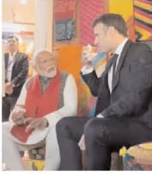
लिए हिंदी शब्द का उपयोग करते हुए कहा कि वह पीएम मोदी के साथ पी गई चाय को नहीं भूलेंगे। मैक्रों ने कहा कि मैं उस चाय को नहीं भूलूंगा जो हमने महल

नई दिल्ली (एजेंसी)। फ्रांस के राष्ट्रपति इमैनुएल मैक्रों भारत की डिजिटल भुगतान प्रणाली युनिफाइड पेमेंट्स इंटरफेस (यूपीआई) से प्रभावित हुए, जिसका उपयोग उस चाय के लिए भुगतान करने के लिए किया गया था जिसका आनंद उन्होंने और प्रधानमंत्री नरेंद्र मोदी ने जयपुर में लिया था। मैक्रों दो दिवसीय राजकीय यात्रा पर भारत में थे और इस वर्ष के गणतंत्र दिवस के मुख्य अतिथि थे। राष्ट्रपति भवन में राष्ट्रपति द्रौपदी मुर्मू द्वारा उनके लिए आयोजित आधिकारिक भोजन में अपने भाषण में मैक्रों ने चाय के