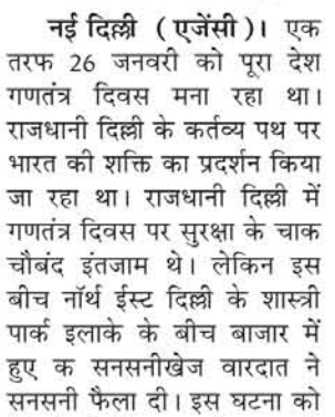
उसे बुरी तरफ मारते-पीटते हैं। उस पर गोली चलाते हैं। इतनी हैवानियत के बाद भी मन नहीं भरता है तो चाकूओं से उसका पूरा शरीर गोद देते हैं। स्कूटी वाला शख्स चाकू से उसका गला रेतने की कोशिश करता है। बुरी तरह से घायल करने के बाद सभी आरोपी लड़के को अचेत अवस्था में छोड़कर भाग जाते हैं। ये पूरी वारदात एक दुकान के सामने हो रही होती है। हैरानी की

नई दिल्ली (एजेंसी)। एक तरफ 26 जनवरी को पूरा देश गणतंत्र दिवस मना रहा था। राजधानी दिल्ली के कर्तव्य पथ पर भारत की शक्ति का प्रदर्शन किया जा रहा था। राजधानी दिल्ली में गणतंत्र दिवस पर सुरक्षा के चाक चौबंद इंतजाम थे। लेकिन इस बीच नॉर्थ ईस्ट दिल्ली के शास्त्री पार्क इलाके के बीच बाजार में हुए क सनसनीखेज वारदात ने सनसनी फैला दी। इस घटना को जिसने भी देखा उसकी रूढ़ कांप गई। इस वारदात का सीसीटीवी फुटेज सामने आया है, जिसके देखकर साफ जाहिर होता है कि अपराधियों के मन में न तो कानून का डर है, न ही पुलिस का खौफ। वारदात को अंजाम देने के बाद सभी आरोपी फरार हैं। पुलिस उनकी तलाश कर रही है। सीसीटीवी फुटेज में साफ दिख रहा है कि बाजार लगा हुआ है। दुकानों पर लोग खड़े हैं। हर