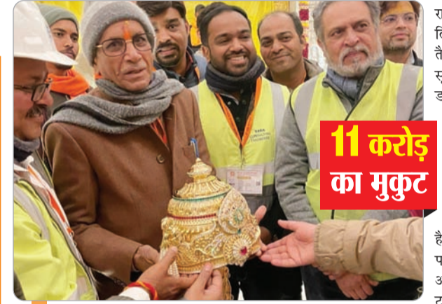
11 करोड़ का मुकुट

दोपहर में रामलला को पूड़ी-सब्जी, खड़ी-खीर के भोग के अलावा हर घंटे दूध, फल व पेड़े का भी भोग लगेगा। रामलला सोमवार को सफेद, मंगलवार को लाल, बुधवार को हरा, बृहस्पतिवार को पीला, शुकवार को क्रीम, शनिवार को नीला व रविवार को गुलाबी रंग वस्त्र पहनेंगे। विशेष दिनों में वे पीले वस्त्र धारण करेंगे। अब रामलला की 24 घंटे के आठों पहरे में अष्टमाम सेवा होगी। इसके अलावा रामलला की छह बार आरती होगी। आरती में शामिल होने के लिए पास जारी होंगे। अब तक रामलला विराजमान की दो आरती होती थीं।