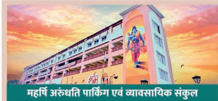
महर्षि अरुंधति पार्किंग एवं व्यावसायिक संकुल