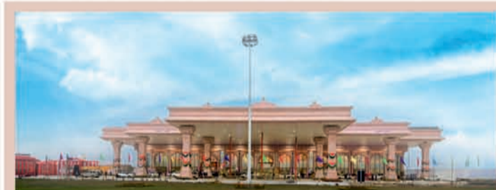
महर्षि वाल्मीकि अंतर्राष्ट्रीय हवाई अड्डा अयोध्या धाम

चौरासी, चौदह एवं पंच कोसी परिक्रमा पथ का चौड़ीकरण एवं सुदृढीकरण