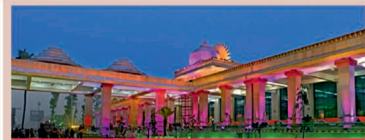
अयोध्या धाम जंक्शन