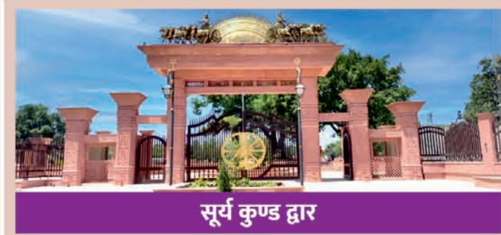
सूर्य कुण्ड द्वार

₹67 करोड़ से महर्षि अरुंधति पार्किंग एवं व्यावसायिक संकुल (पूर्वी एवं पश्चिमी)