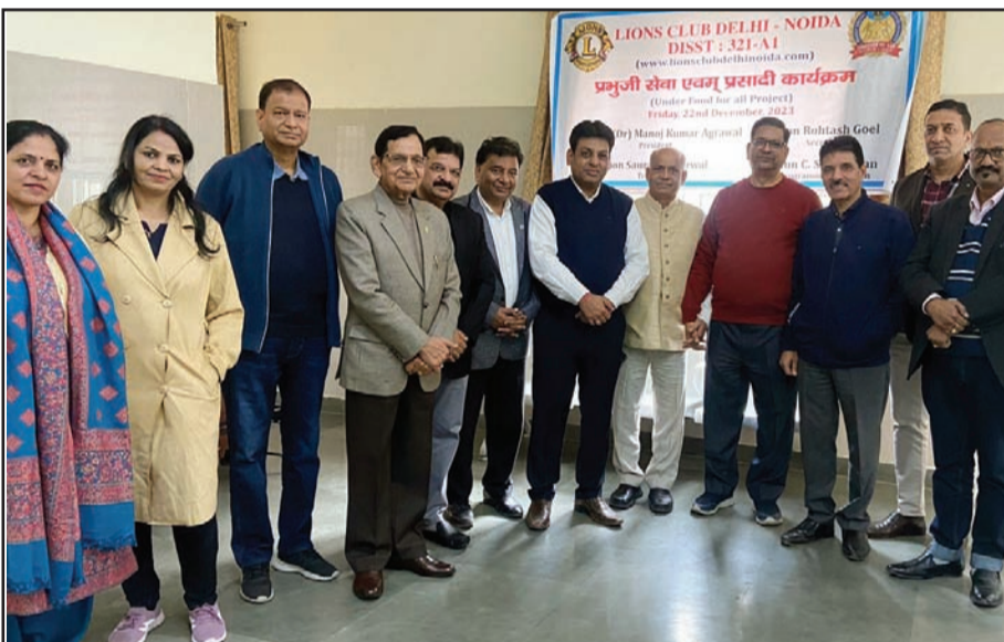
अपना घर आश्रम में प्रभुजी सेवा एवं प्रसादी कार्यक्रम में शिरकत करते लायंस क्लब दिल्ली एवं नोएडा के पदाधिकारी।