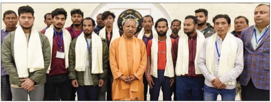
चिकित्सकीय देखरेख के बाद मजदूरों को मजदूरों का एक ऐसा ही समूह आज अलग-अलग जिलों के 15 मजदूर यहां उनके घरों में भेजा जा रहा है। यूपी के सुबह 6 बजे लखनऊ पहुंचा। यूपी के पहुंचे। (शेष पृष्ठ-3 पर)

सब जानते हैं कि उत्तराखंड के उत्तरकाशी की सिलक्यारा सुरंग में 17 दिनों से फंसे 41 श्रमिकों को मंगलवार को बाहर निकाल लिया गया था। प्रार्थमिक