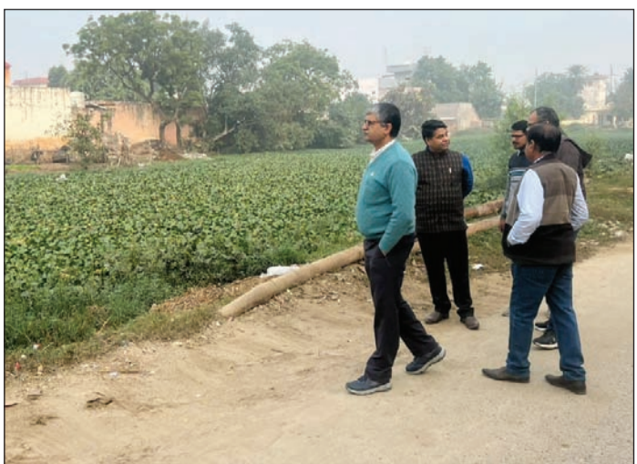
कि ग्रेटर नोएडा के सभी तालाबों की सफाई और सौंदर्यकरण का कार्य चल रहा है। एक तरफ तालाबों में गंदगी को साफ किया जा रहा है तो दूसरी तरफ गंदगी को तालाबों में जाने से रोकने पर भी काम चल रहा है। इसके साथ ही अब