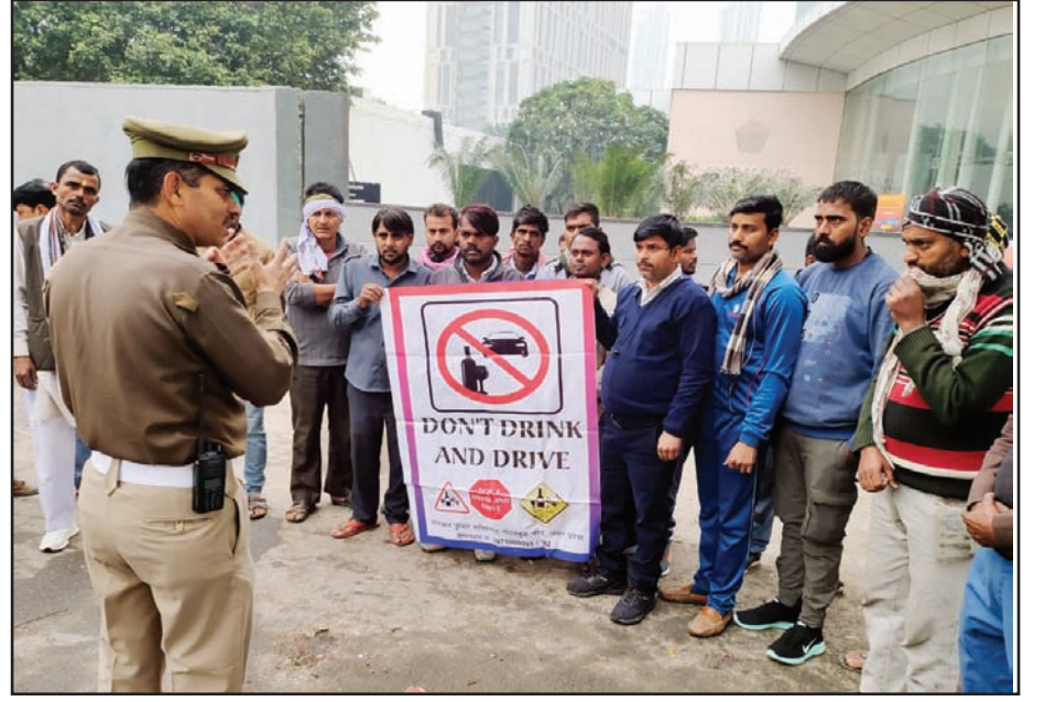
यातायात पुलिस द्वारा चलाए जा रहे यातायात माह के दौरान ट्रैफिक पुलिसकर्मियों द्वारा ओखला बर्ड सैंक्चुरी मेट्रो स्टेशन सेक्टर-94 पर जन सामान्य व ऑटो/टैप्पो, ई-रिक्शा चालकों को यातायात नियमों/संकेतों के प्रति जागरूक किया गया।

इलाके में शव मिलना चर्चा का विषय बना हुआ है। इंदिरापुरम में तीन दिन पहले सोसायटी में युवती का शव मिला था।